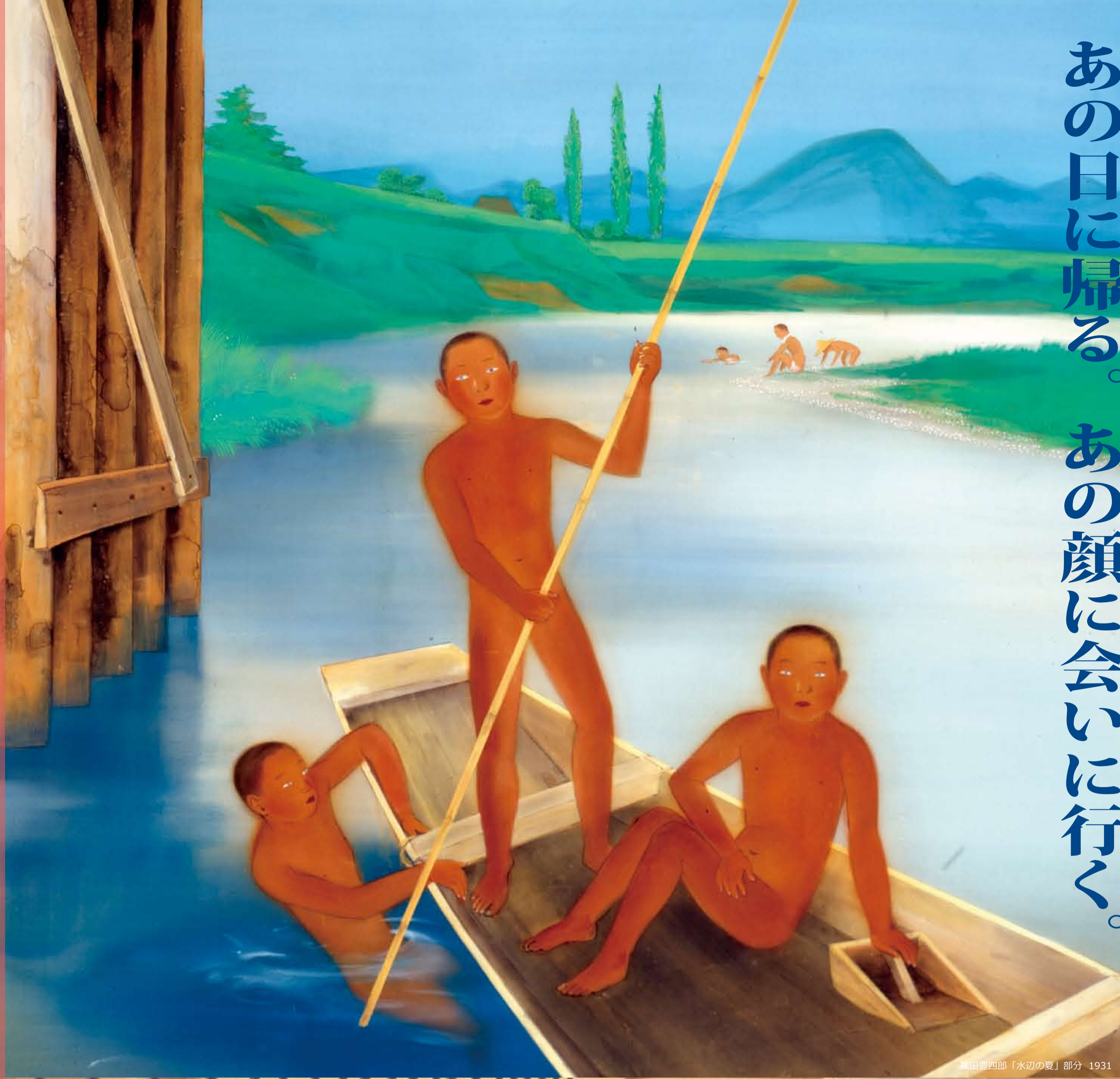
田辺豊四郎「水辺の夏」部分 1931