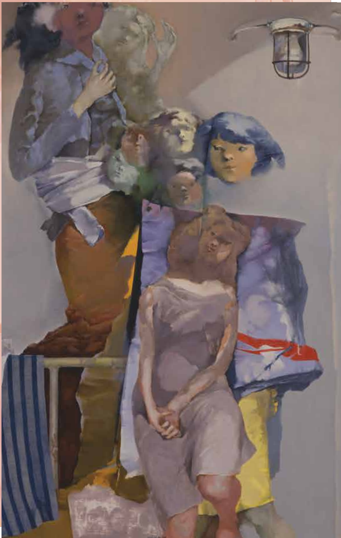
紺野五郎 <見送り人席> 1980年