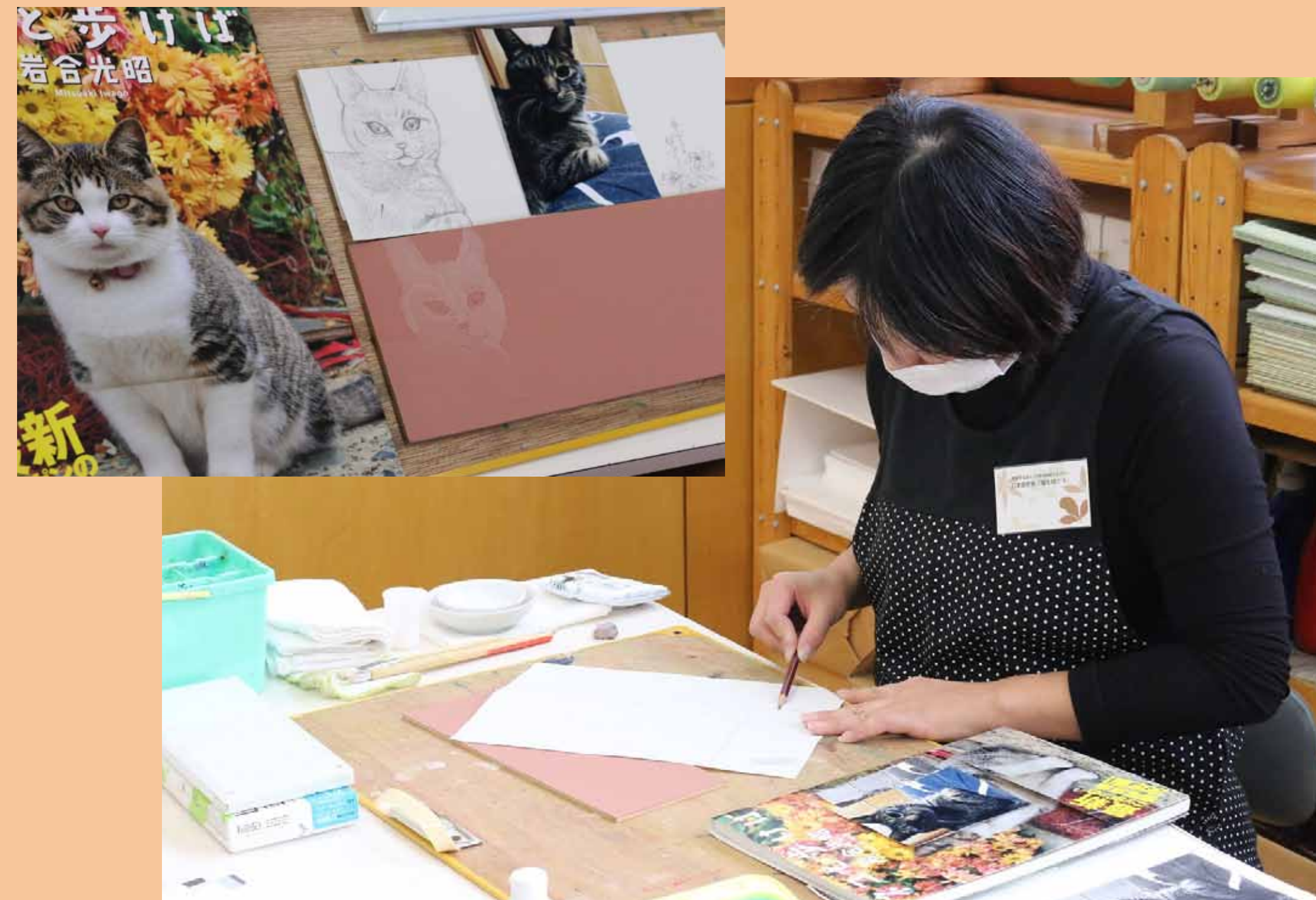
2. 持参してきた下絵を、好きな大きさのボードへ転写します。