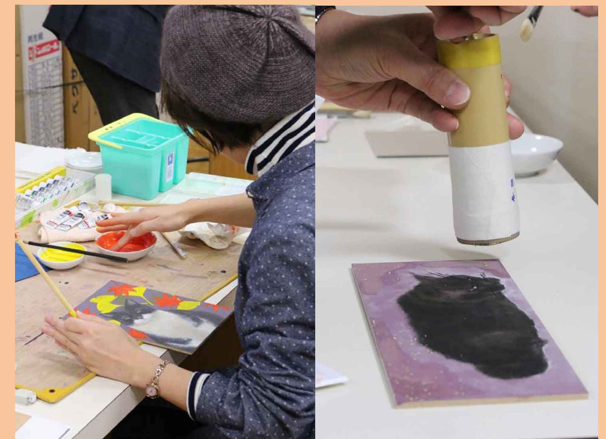
5. 下地を盛り上げたり、金箔をまいたりもしてみました！