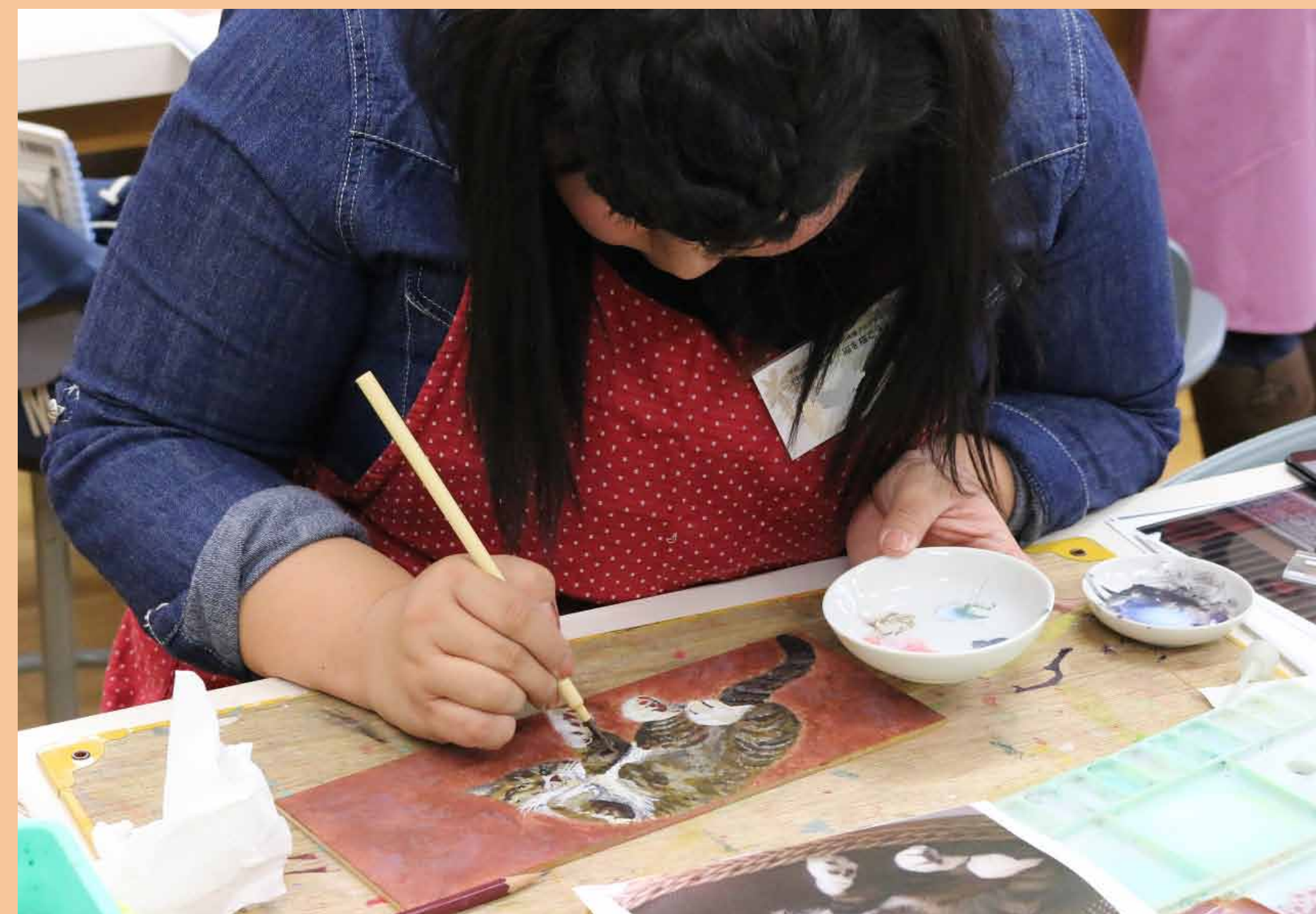
3. おおまかな部分は、乾燥の早いアクリル絵の具で着色しました。