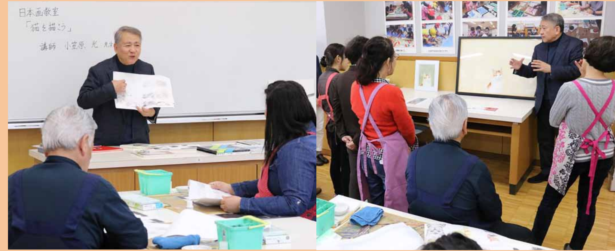
1. 猫を描く際のポイント等について、先生からお話をいただきました。