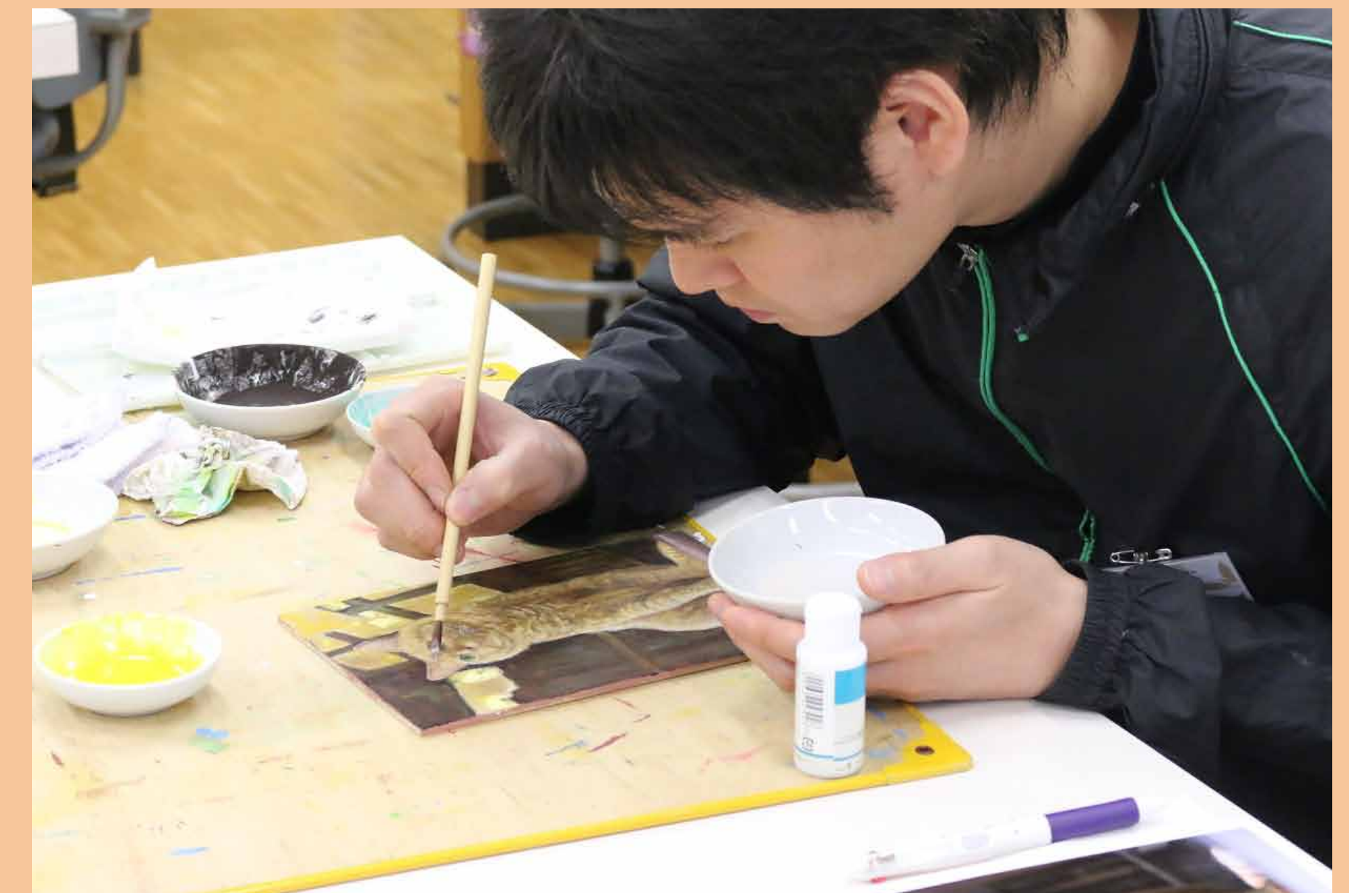
6. 細部まで描きすすめて完成！猫への思いが伝わってきますね～。