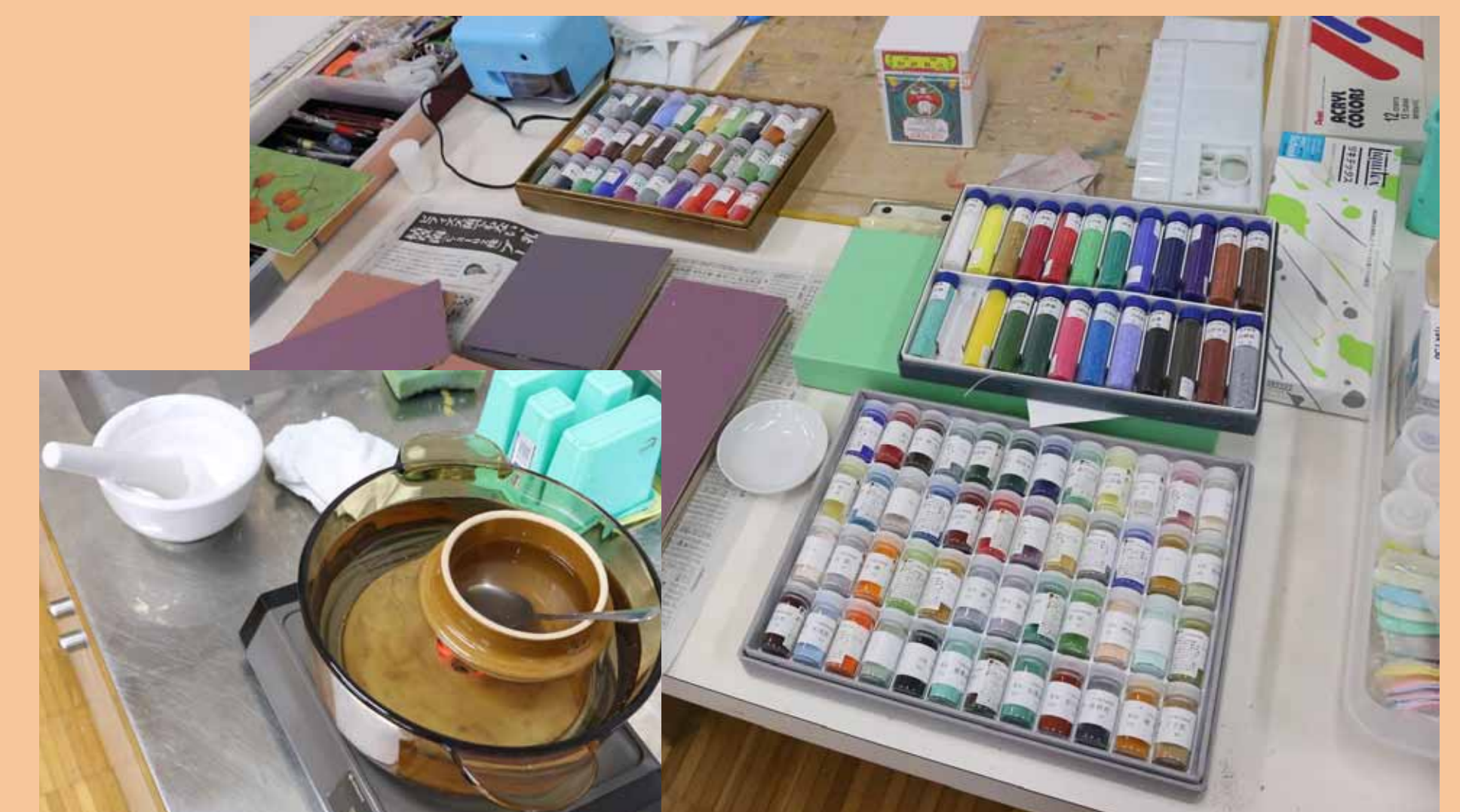
4. ある程度描いたら本格的に岩絵の具や胡粉、にかわを使います！