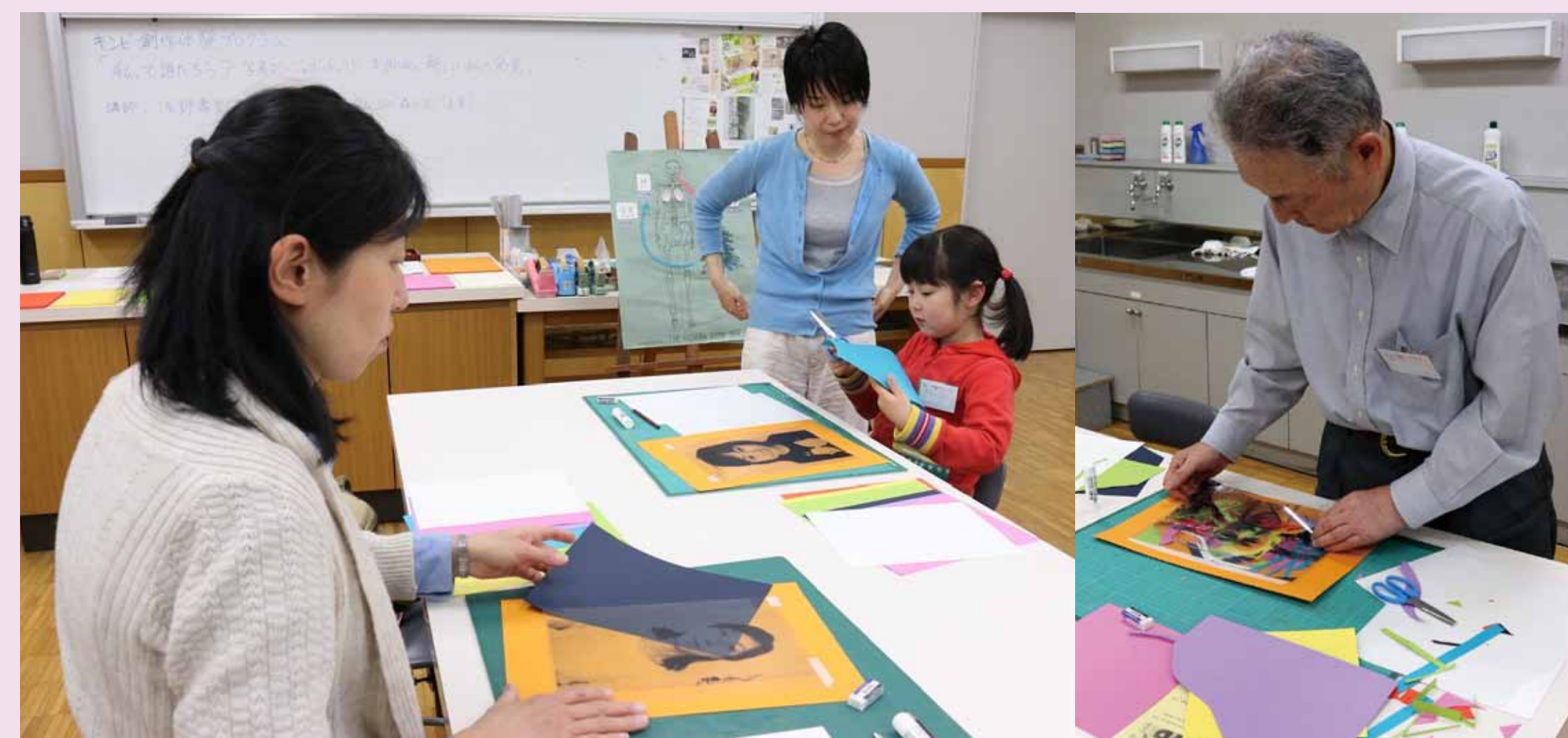
4. 透明シートに印刷した写真に、さまざまな色と形を重ねていきました。