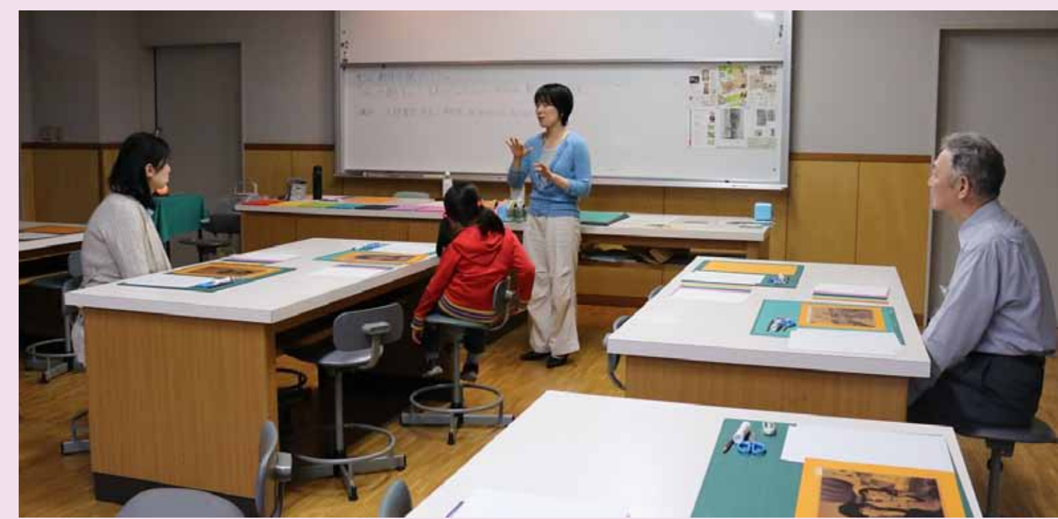
1. ごあいさつの後、今日の活動内容について、お話していただきました。