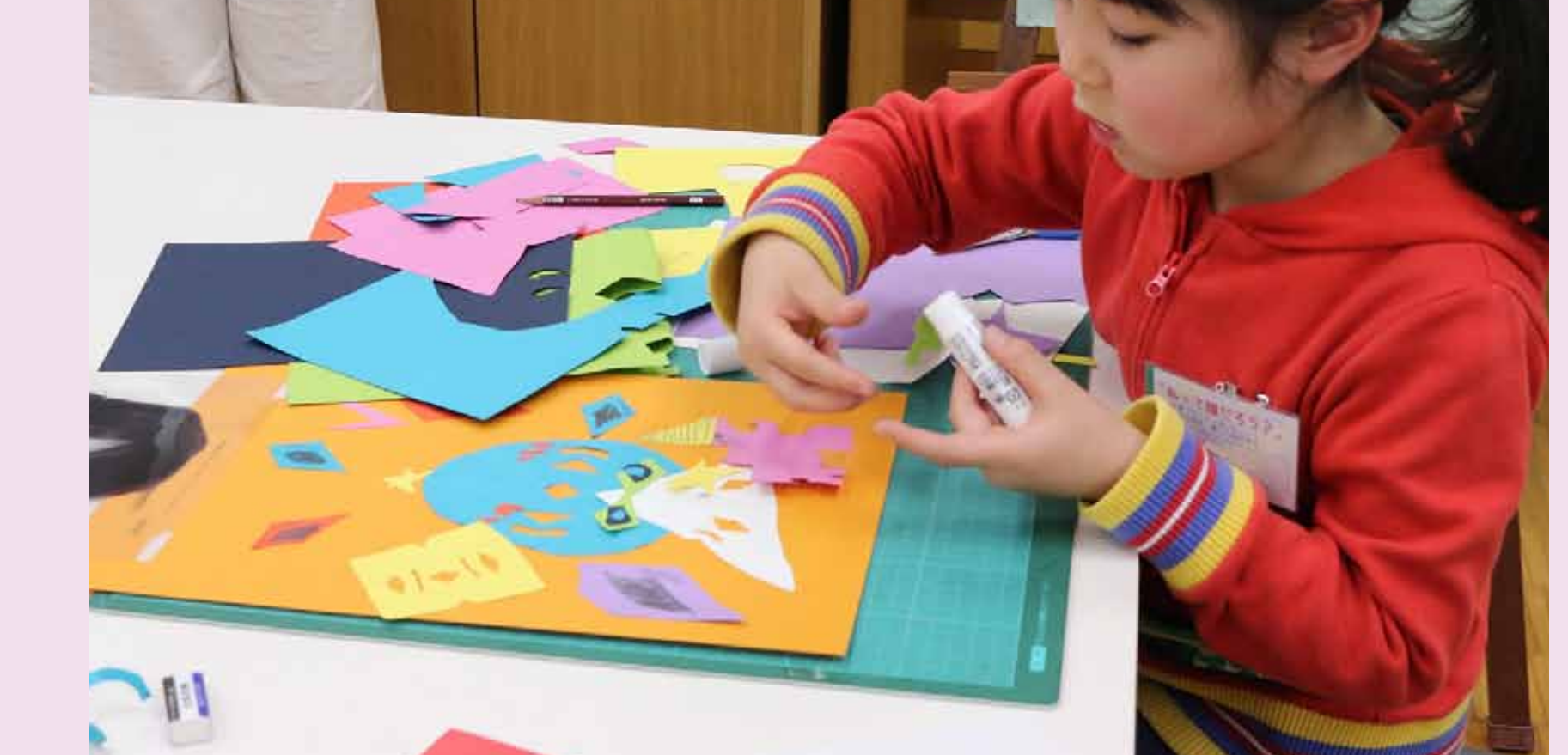
6. 写真の下にある色紙の模様も、とってもキレイです!