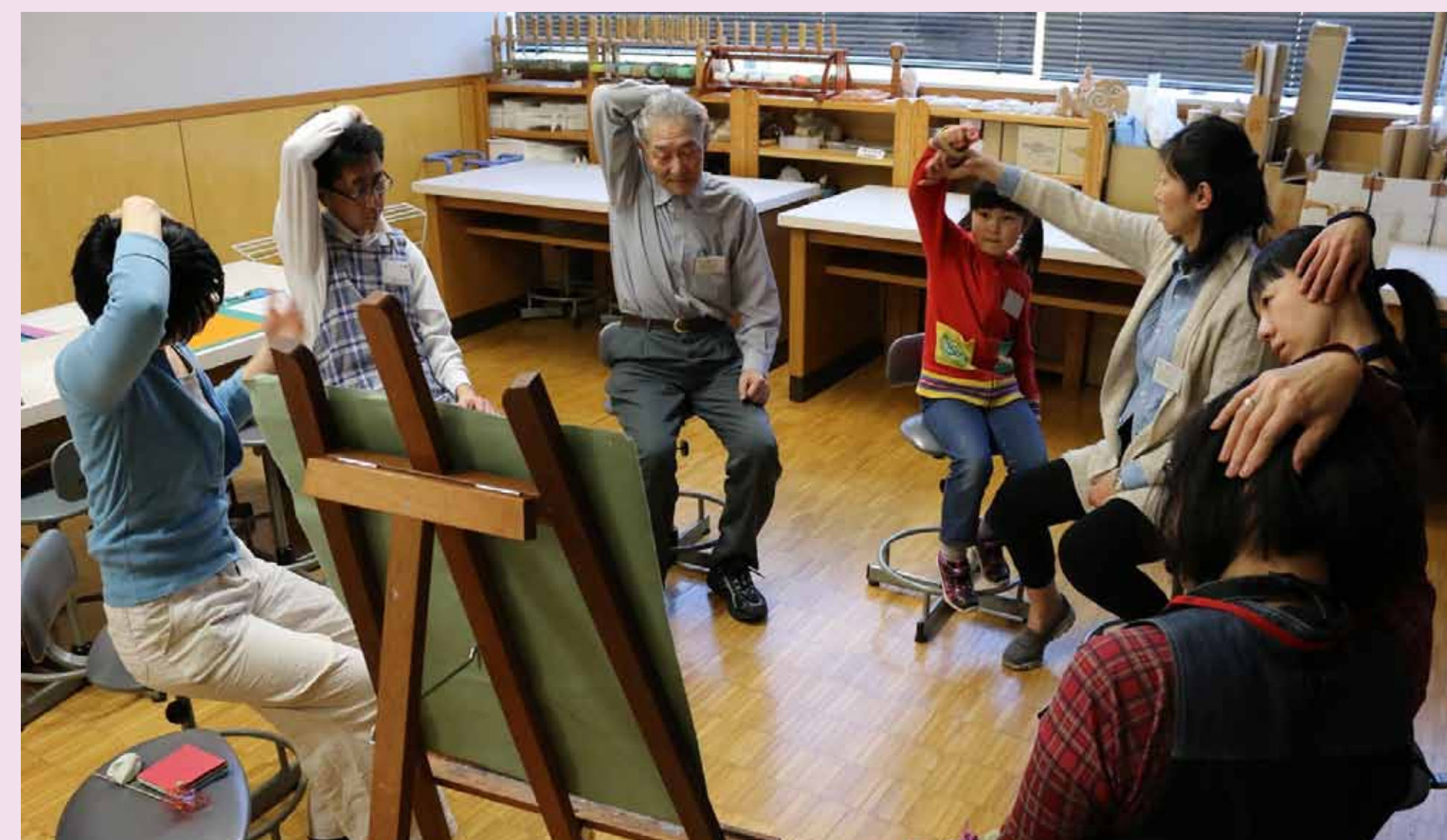
3. 制作前にリラックスのため、瞑想とストレッチなどを行います。