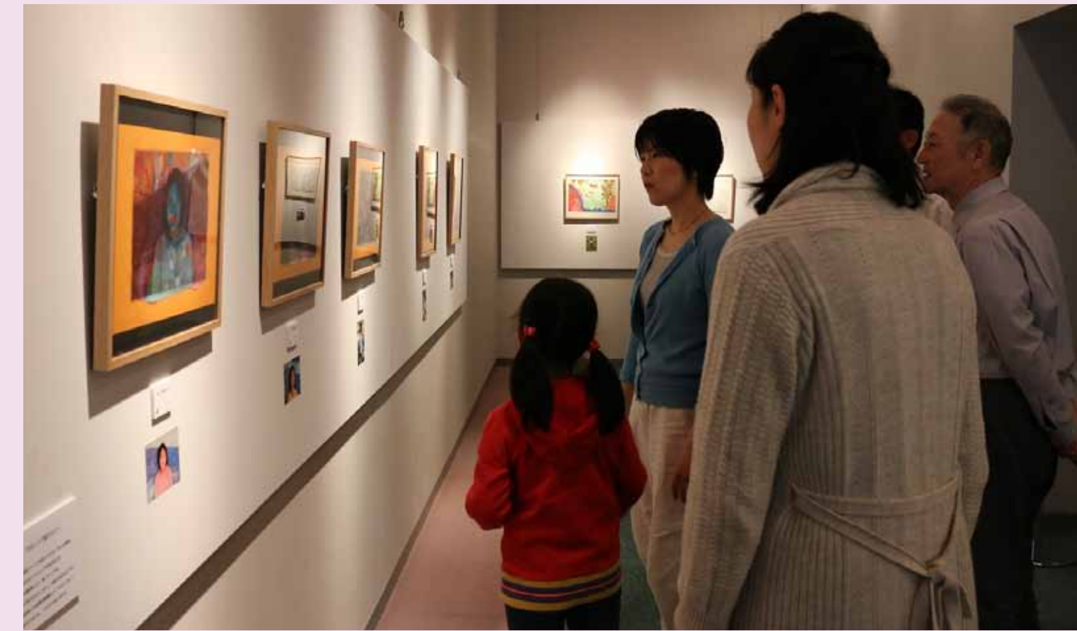
2. 参考作品を見に5階ふれんどりーギャラリーへ。どうやって作っているのかな?