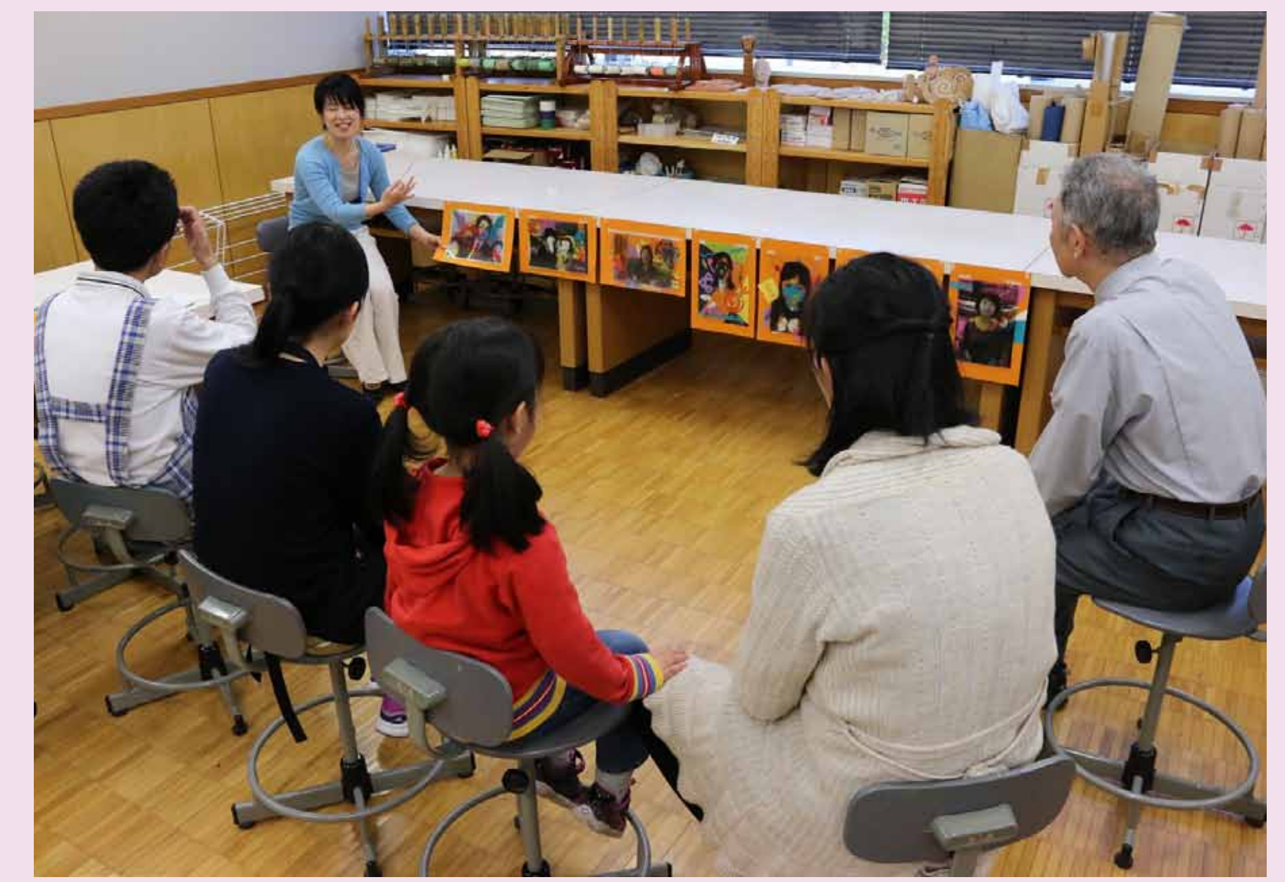
7. 合評会で先生から各作品についてコメントをいただきました。