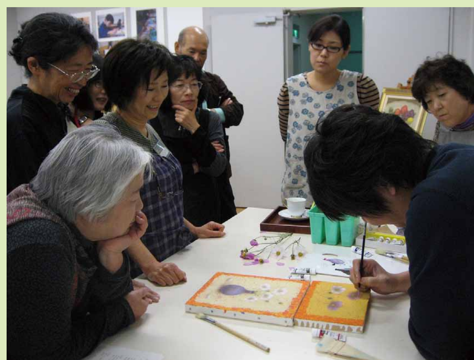
5. 注目！先生からお手本が示されます！