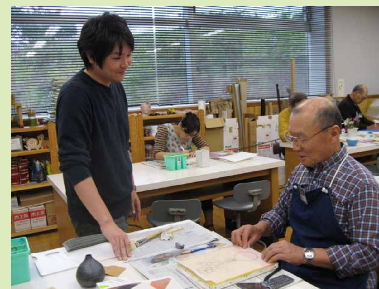
3. 乾燥後ヤスリがけした下地にスケッチを転写。