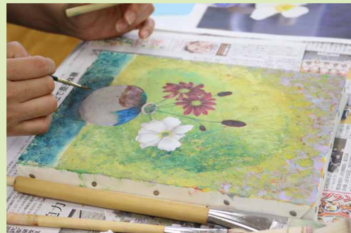
7. さらに描きこみます。細かい部分をもっとやりたくなってきた？