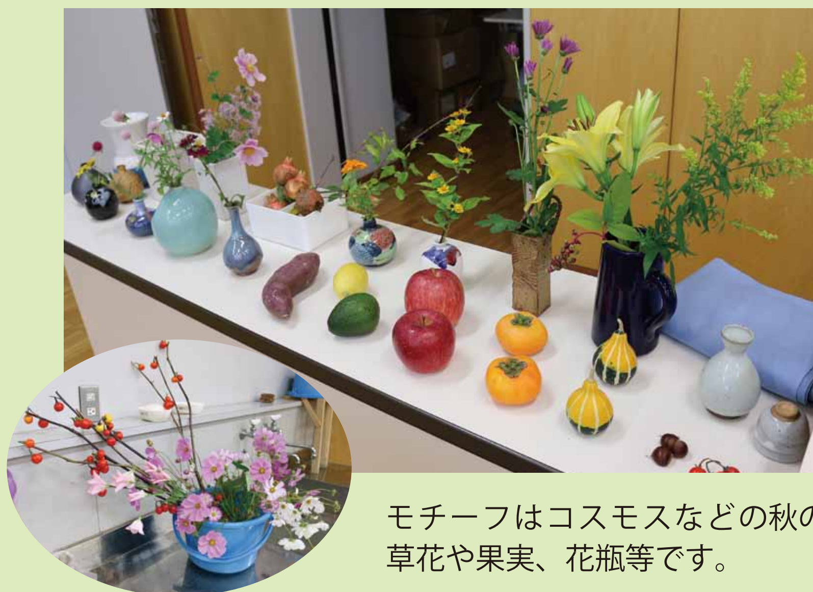
モチーフはコスモスなどの秋の草花や果実、花瓶等です。