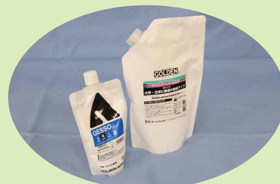
1. 今回の制作で下地や着彩に使った画材です。