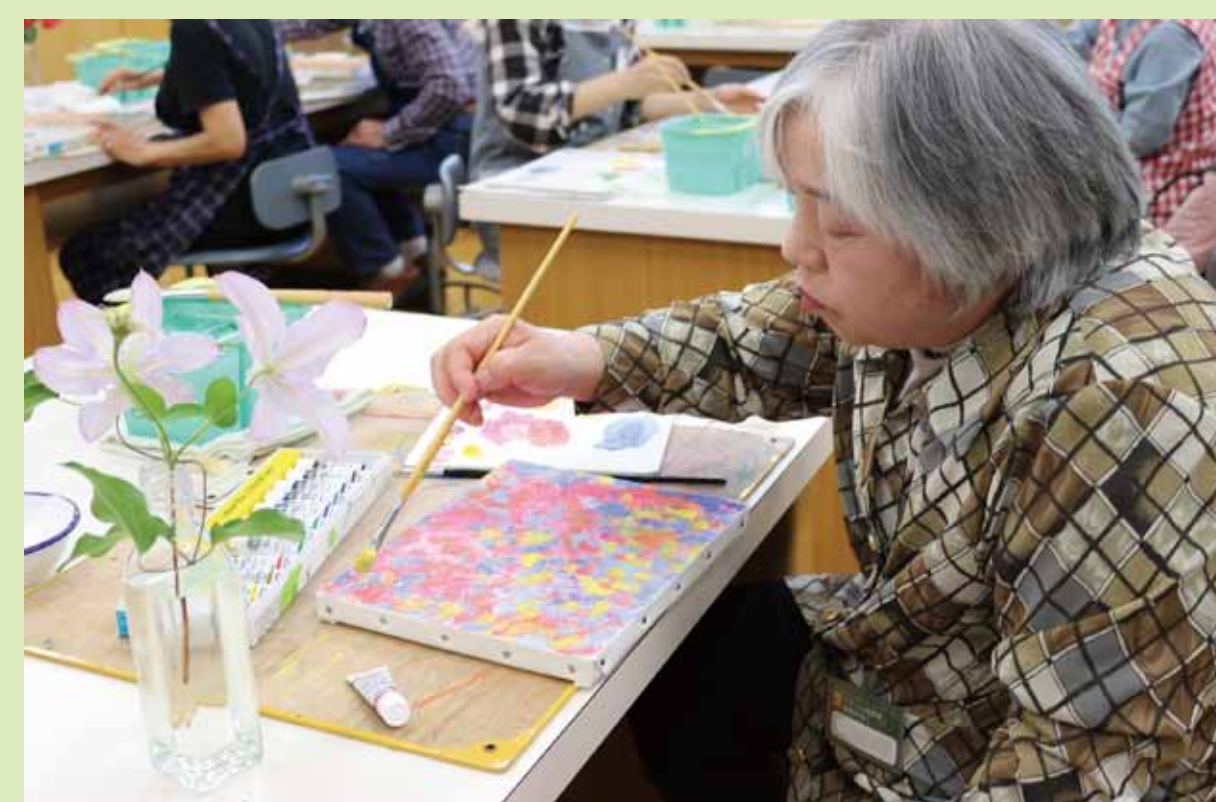
2. アクリル絵の具を重ねて下地をつくります。