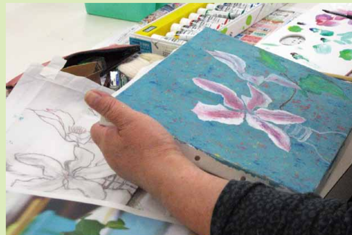
4. 絵の具でおおまかに着彩します。