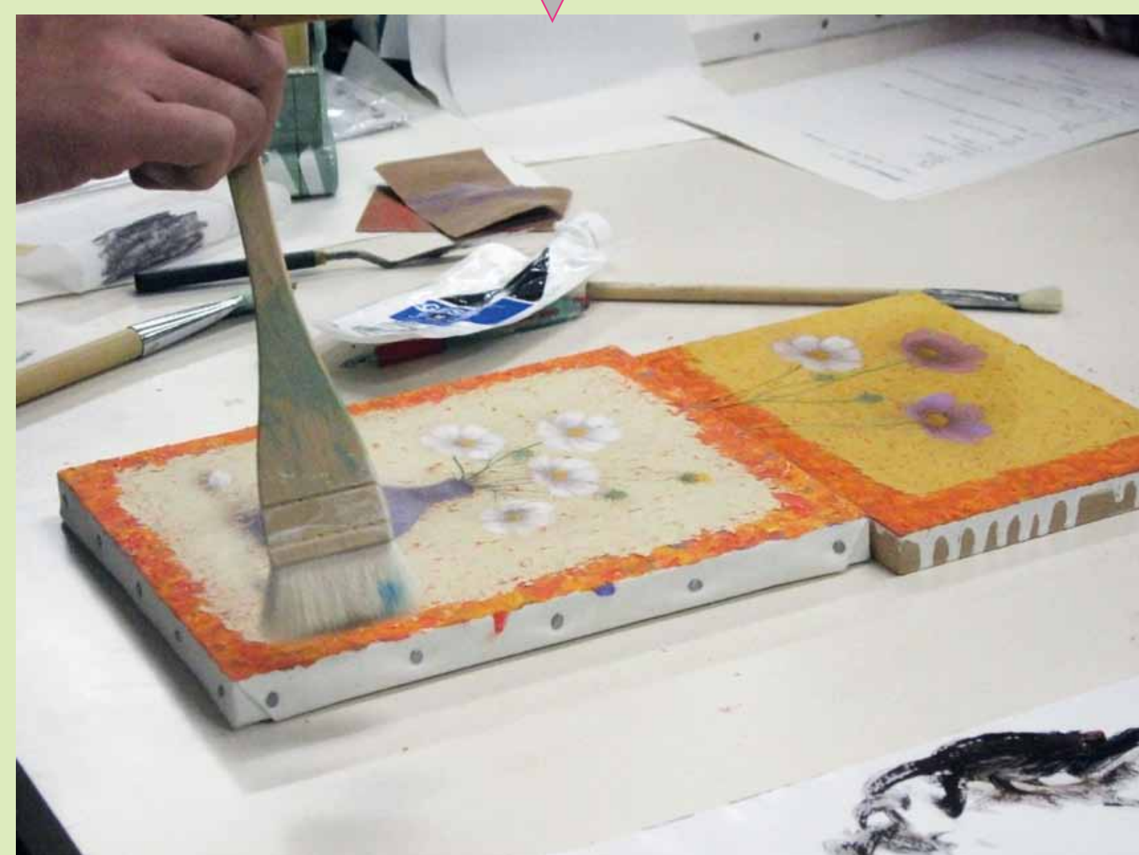
6. オリジナルのぼかしの技法を伝授中・・・！