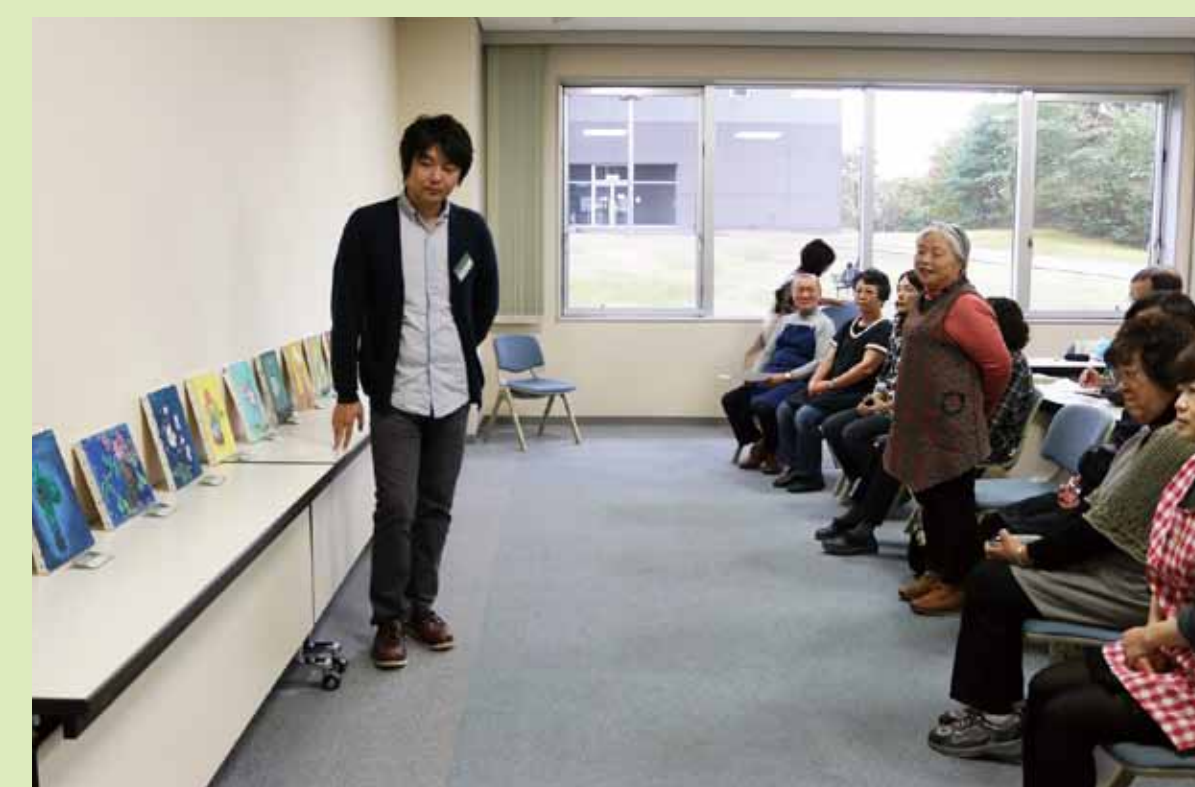
9. 最後はみんなで合評会を行いました。