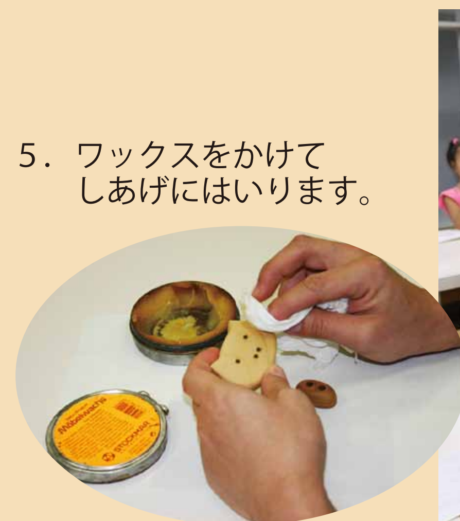
5. ワックスをかけてしあげにはいります。