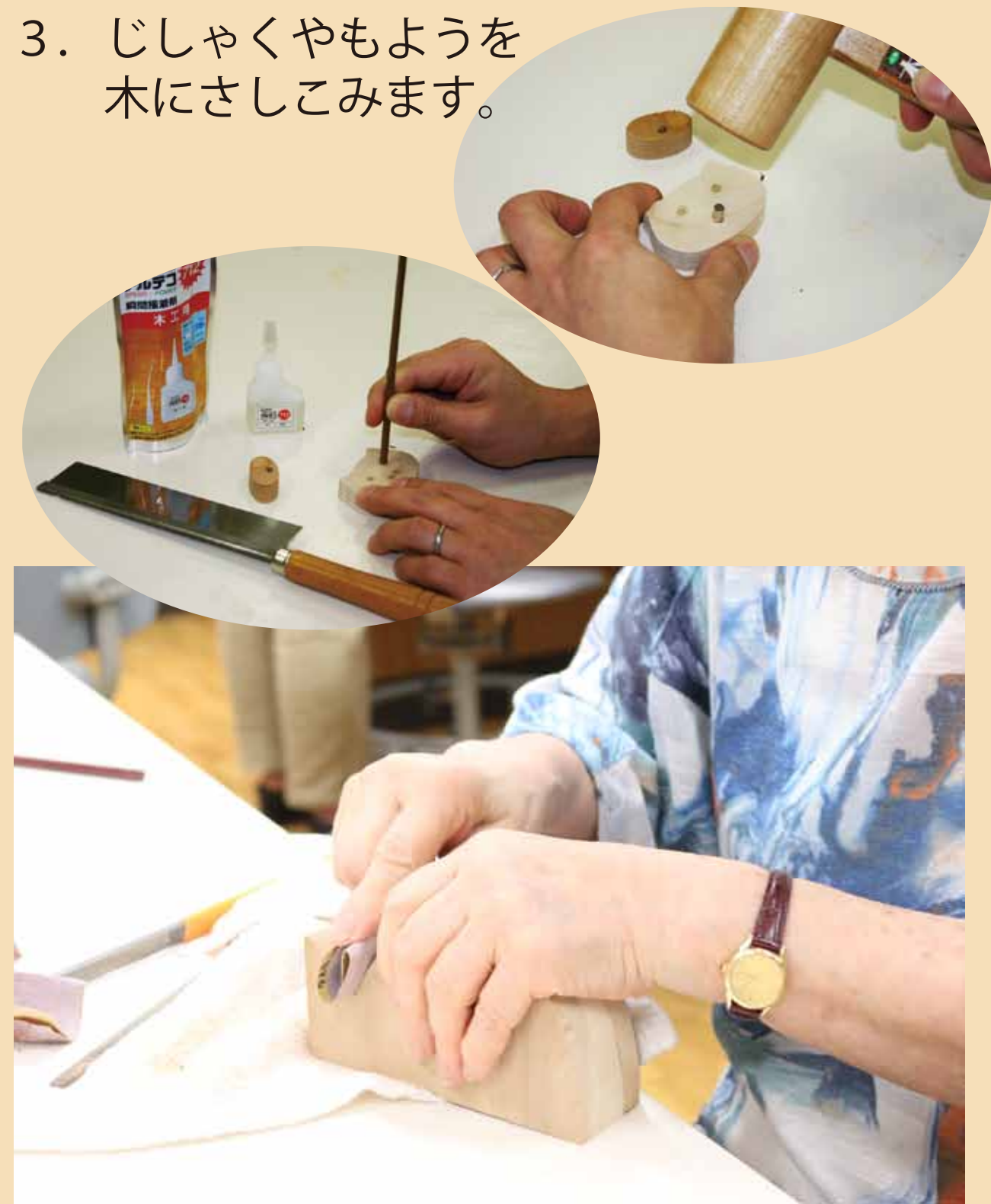
3. じしゃくやもようを木にさしこみます。