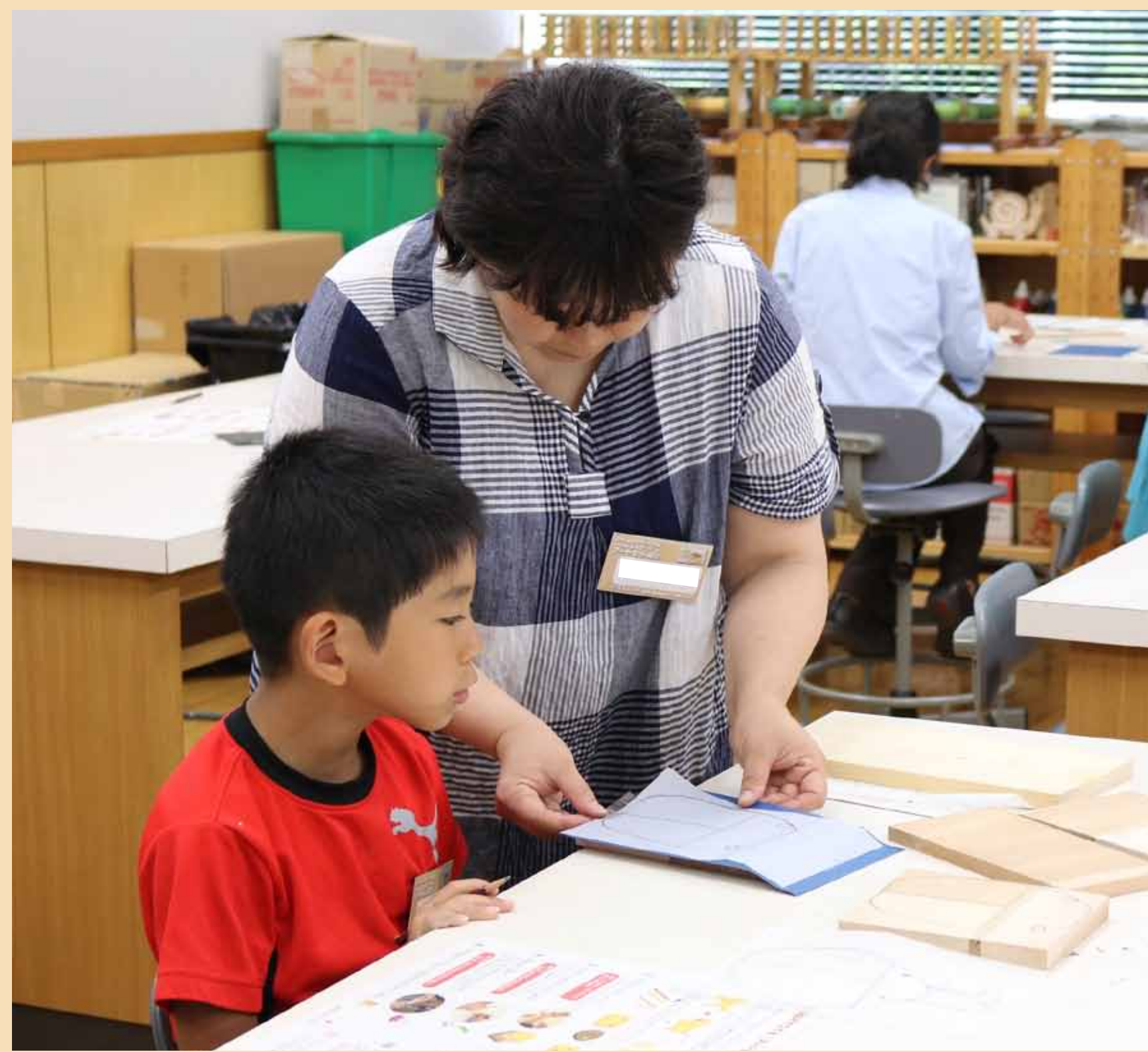
1. デザインが決まったら木をえらんでうつつします。