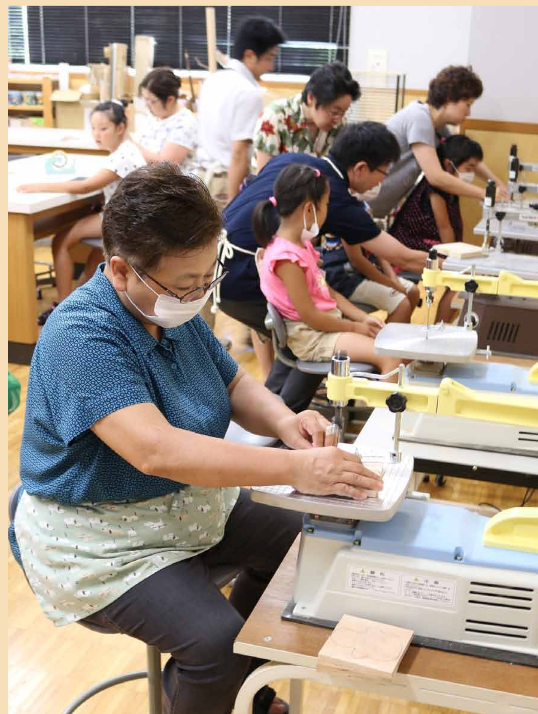
2. 糸ノコで木をきりぬきます。