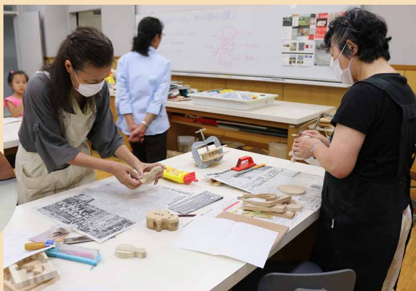
もうひといき！しんけんさがつたわってきますね。