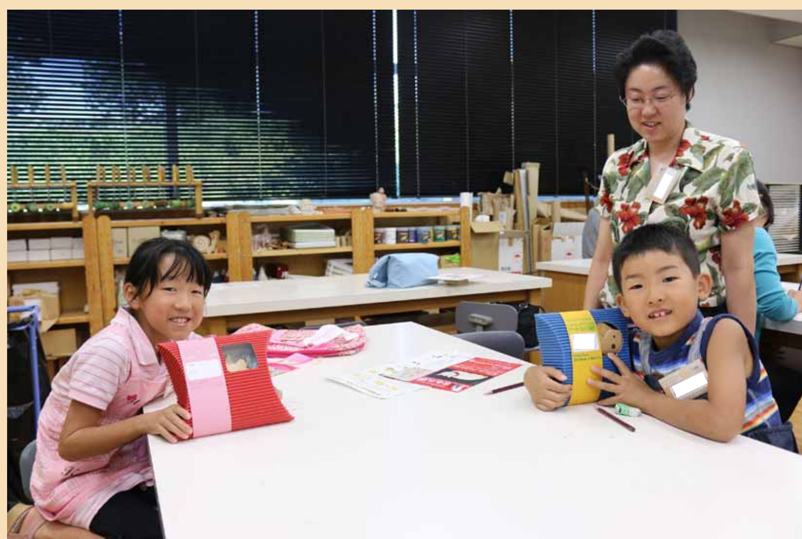
6. 完成！作品をボックスに入れておもちかえりです！