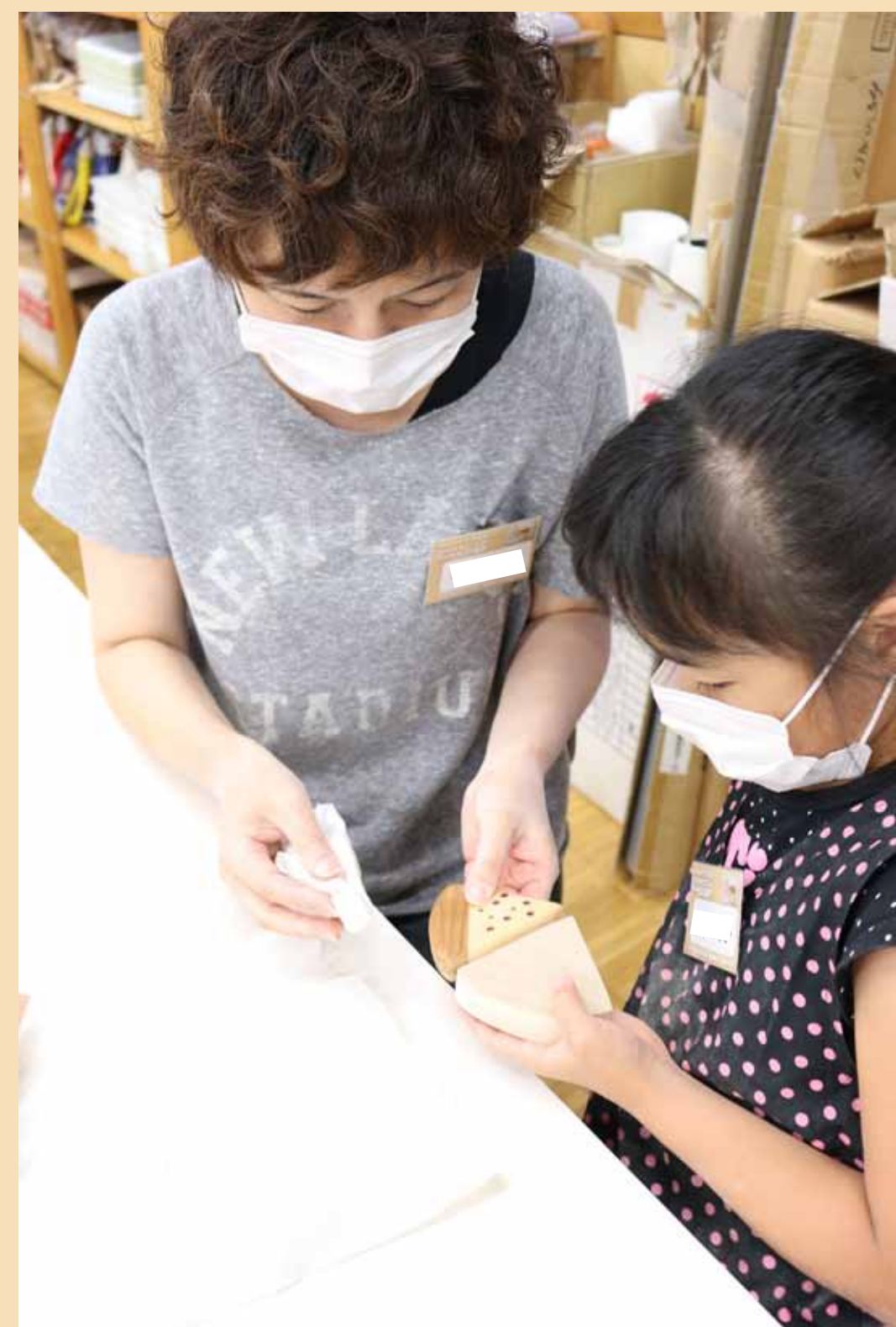
じょうずにできたかな？