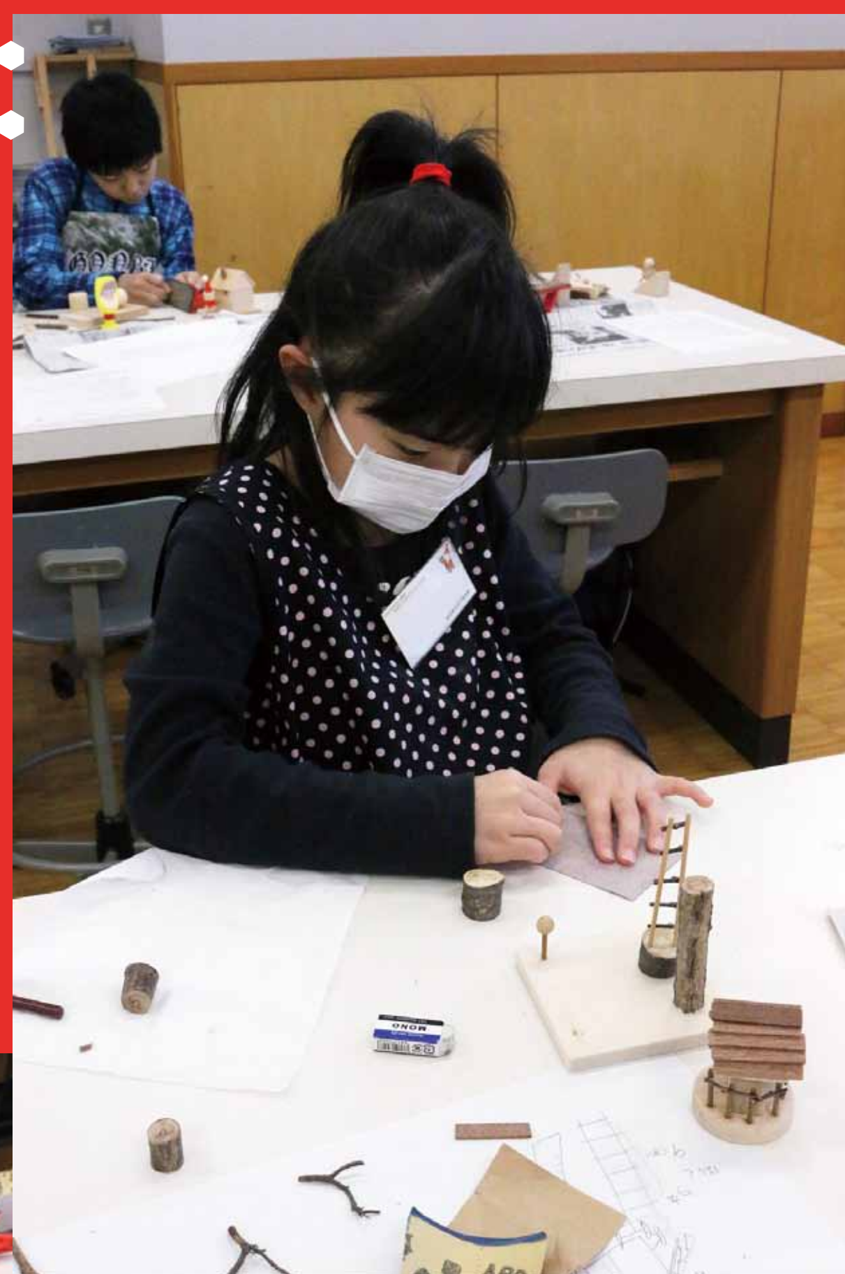
4. ピタリと合うように、ヤスリがけです。