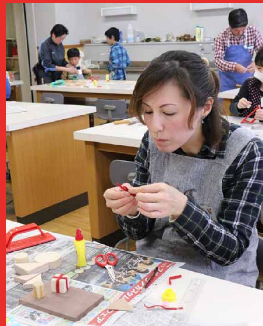
5. フェルトで飾ってみたり。