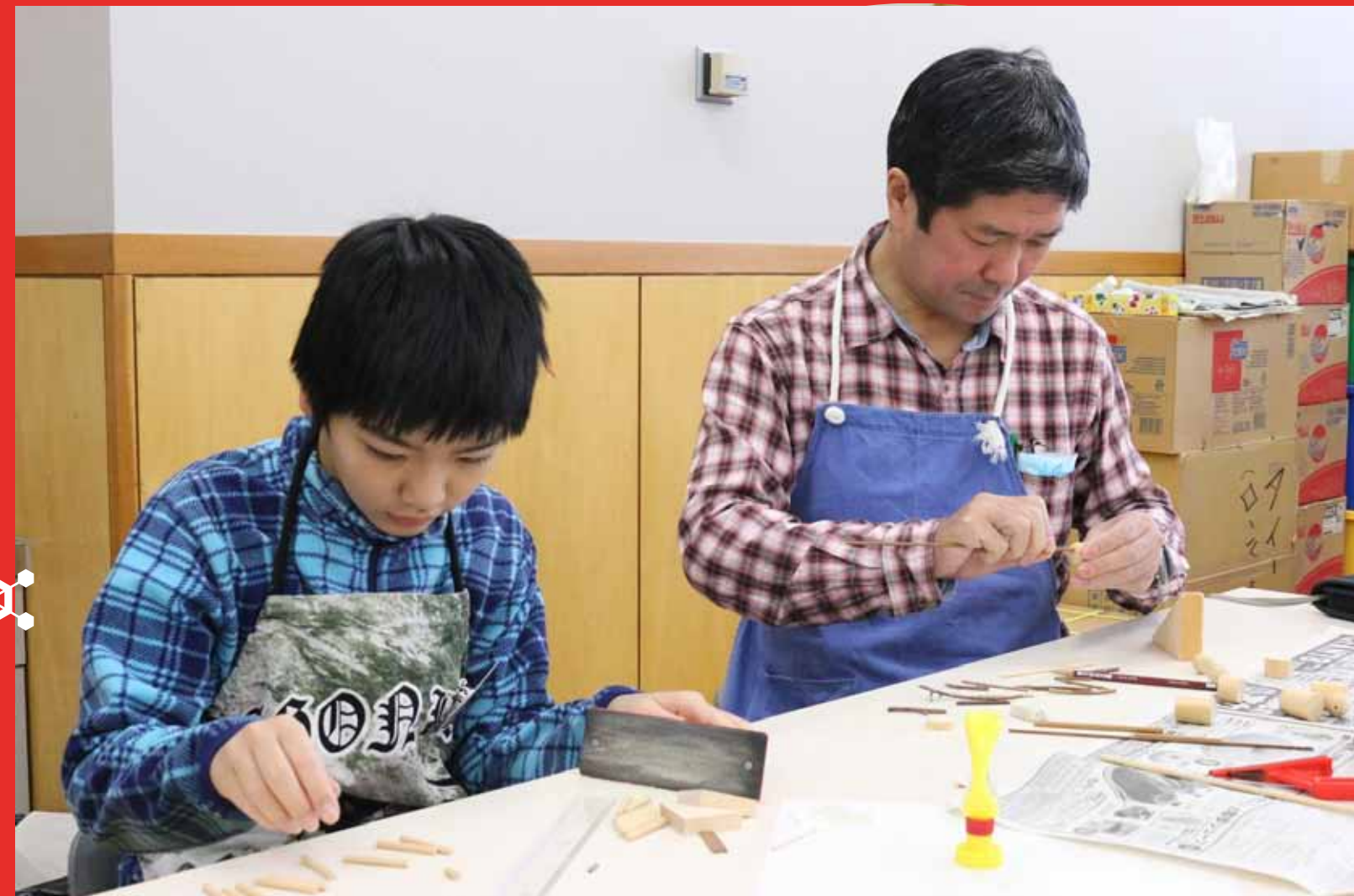
3. お父さんもいっしょに作りました！