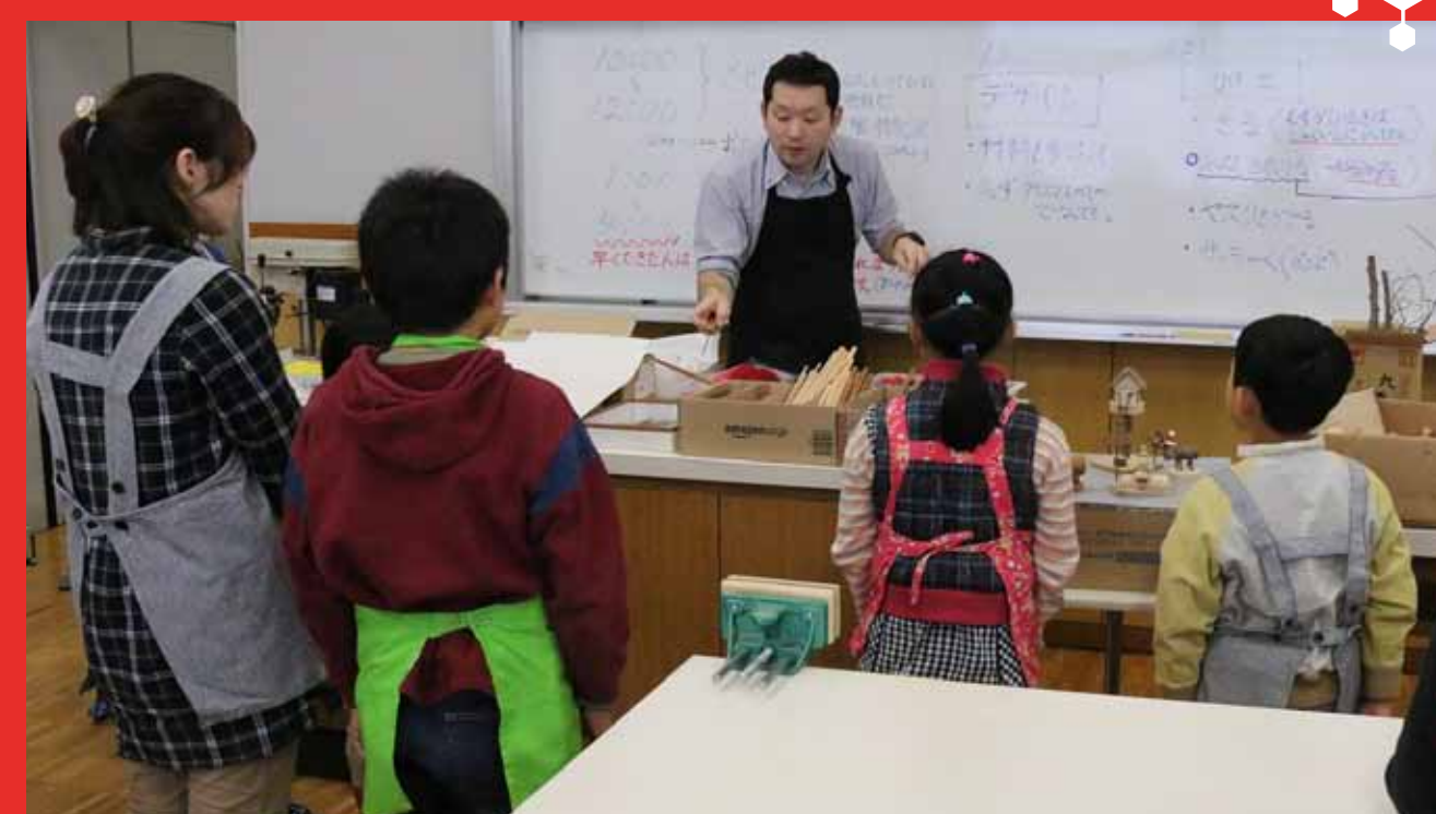
1. 作り方についての説明です。