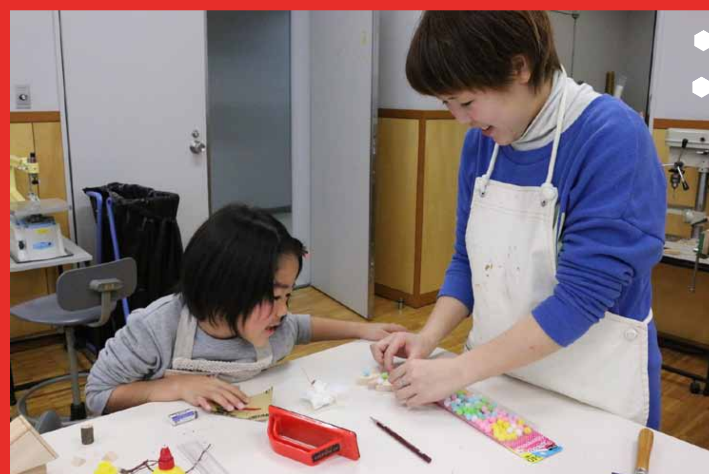
6. ツリーがにぎやかになってきましたね。