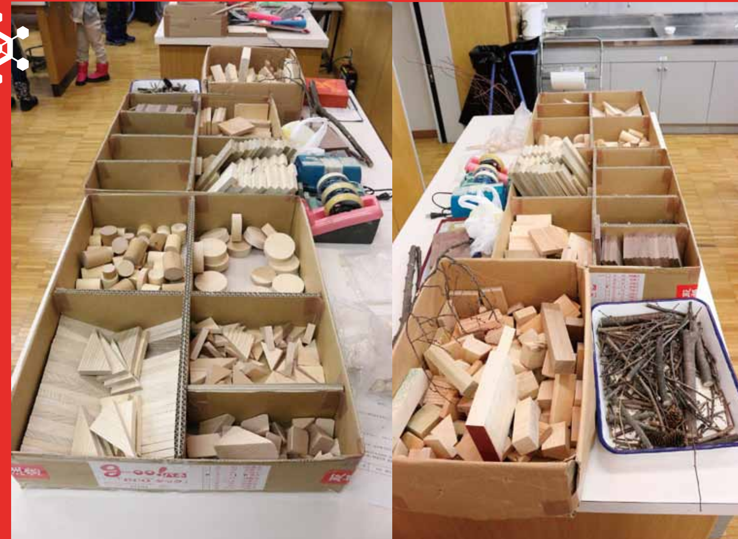
いろいろな形からイメージをふくらませました。