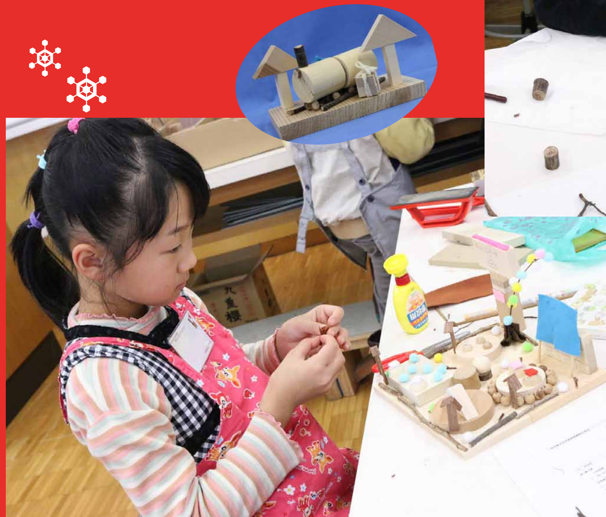
7. 楽しい温泉ランド完成。夢のある作品がたくさんできあがりました！