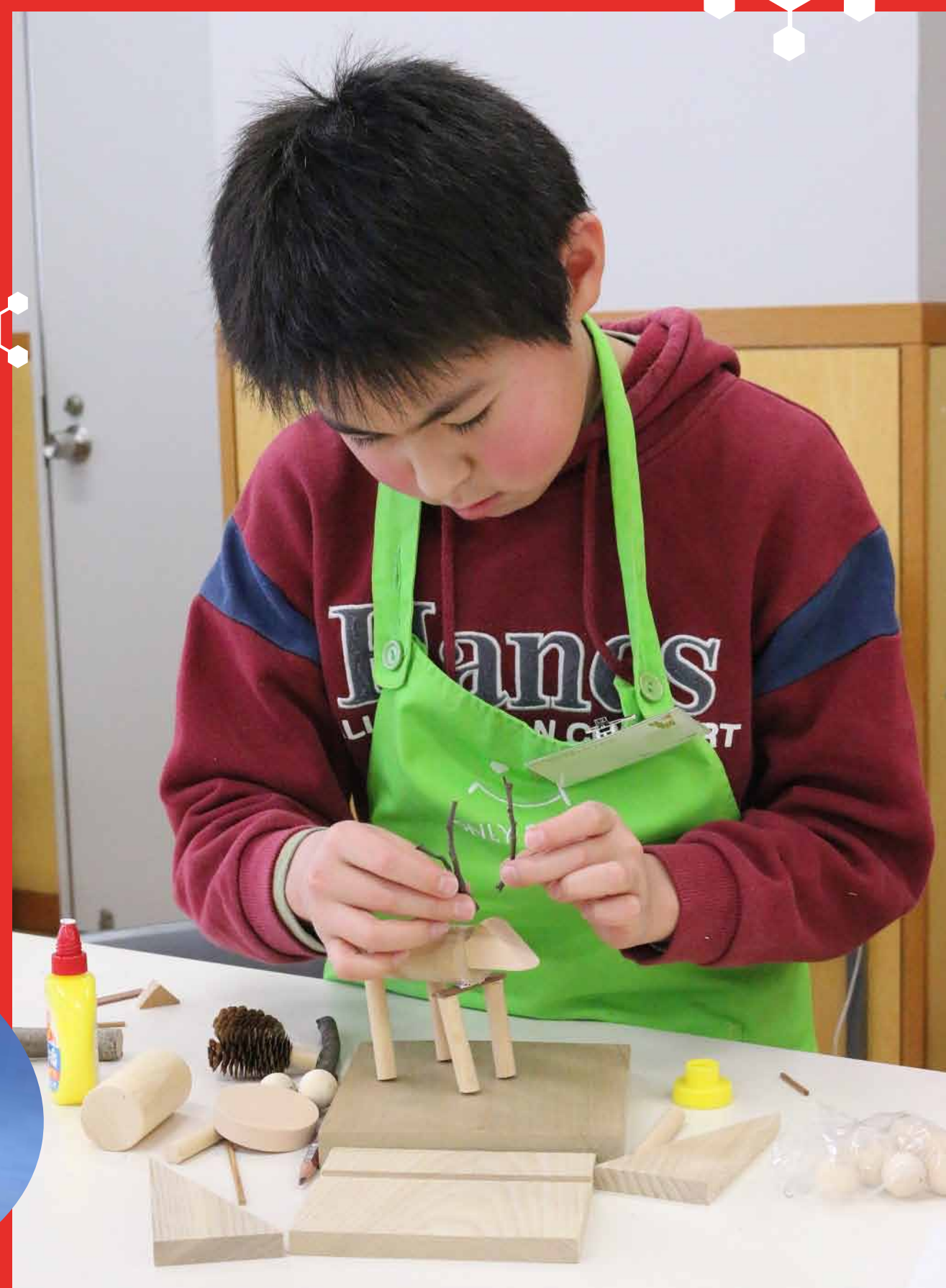
2. 桜の小枝をツノに見立てて・・・！