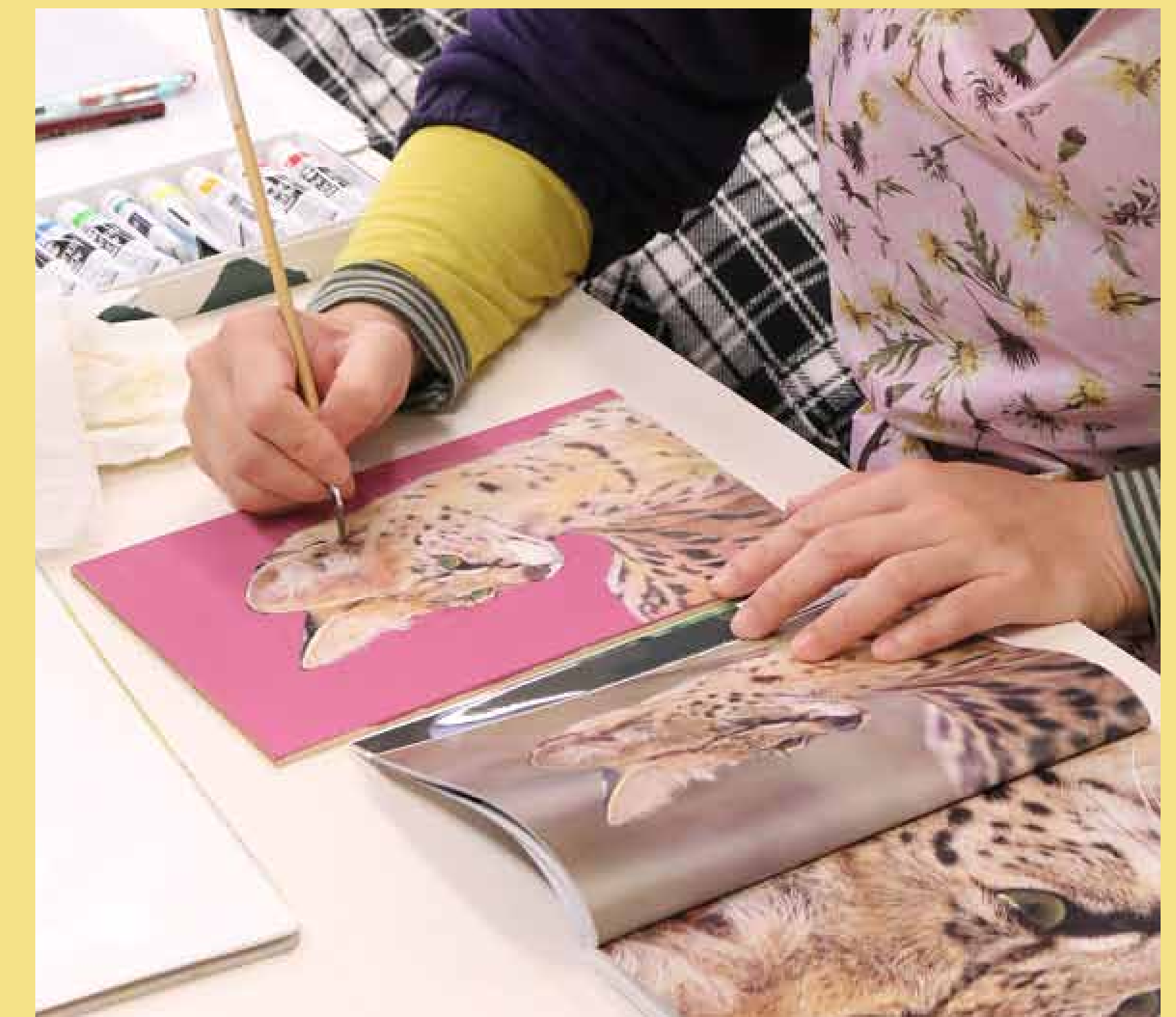
5. アクリル絵の具等での着色がほぼ完了しました！