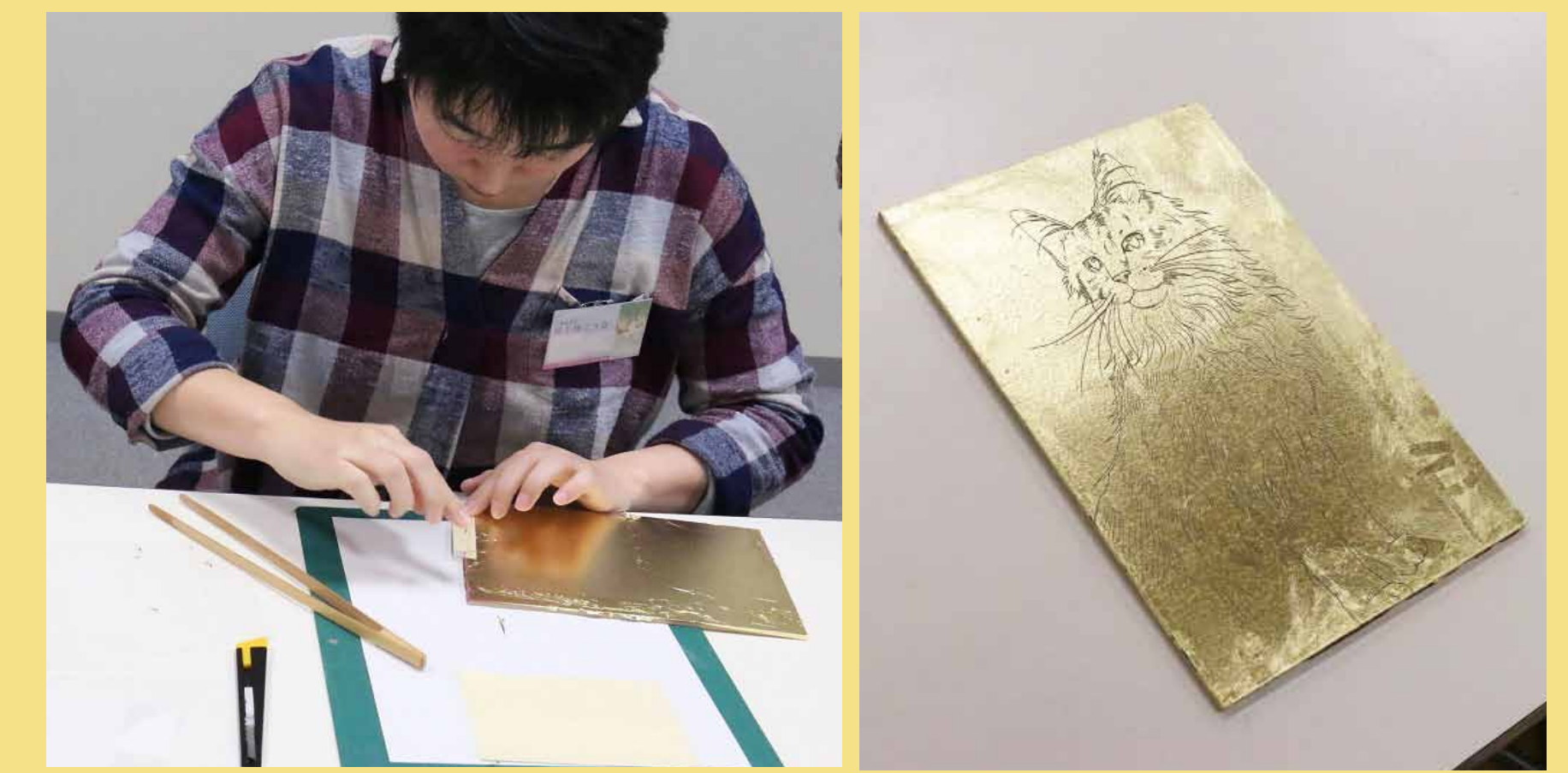
4. 金箔貼りにも挑戦！緊張しますね～？！