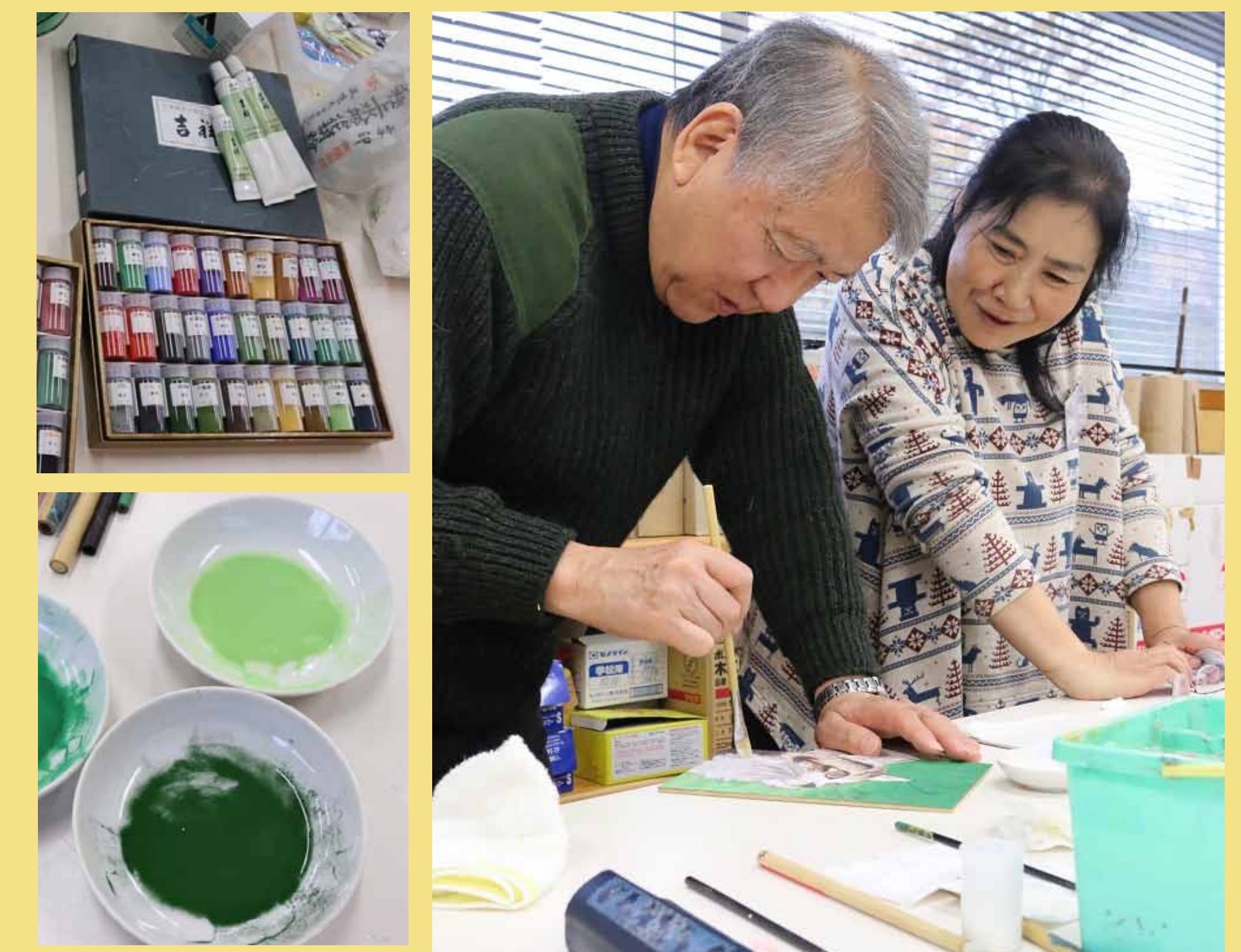
6. 仕上げに岩絵の具で調子を調整完成です！良い感じですね！