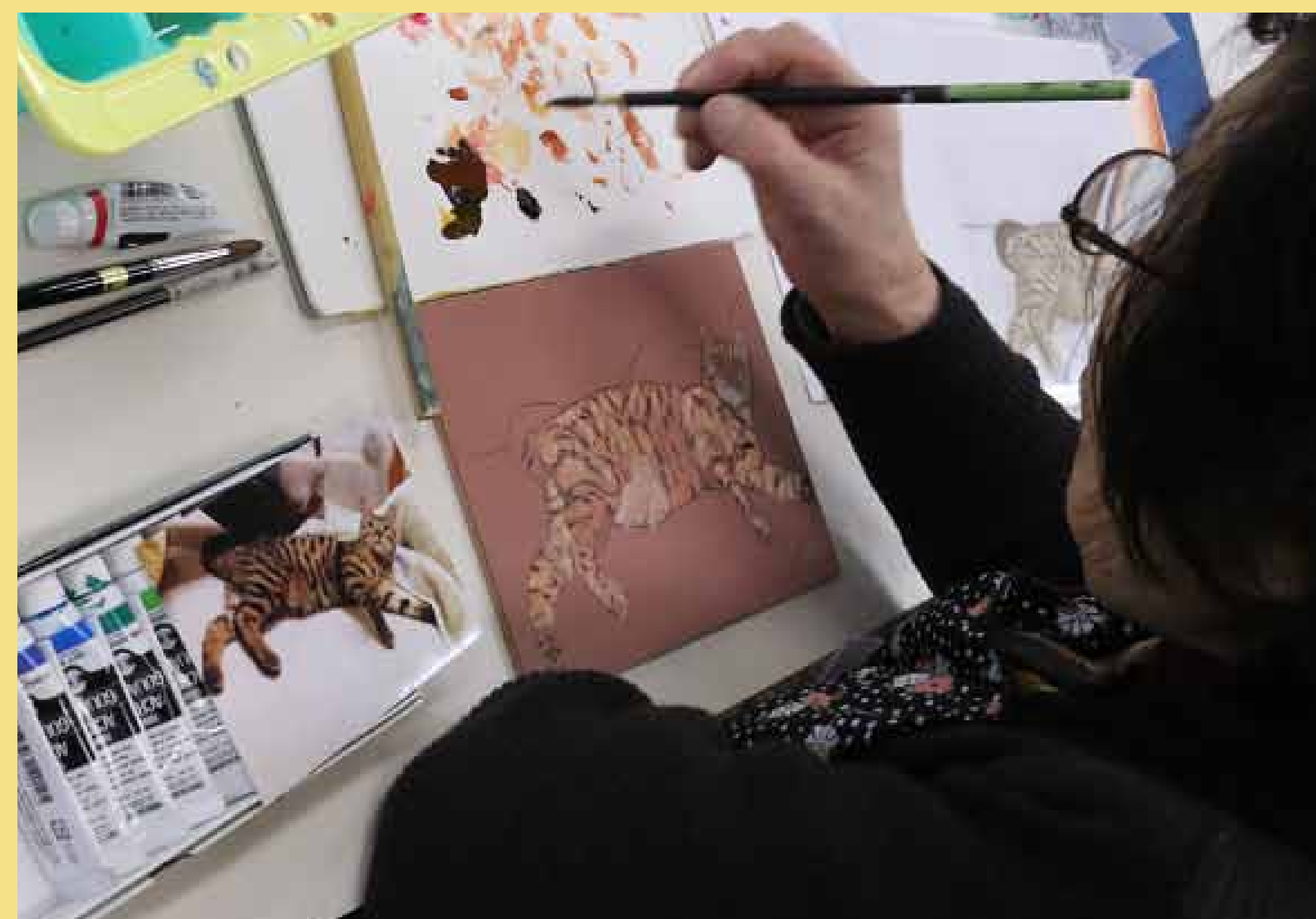
3. アクリル絵の具に方解末を混ぜ、ザラザラな下塗りをつくってゆきます。