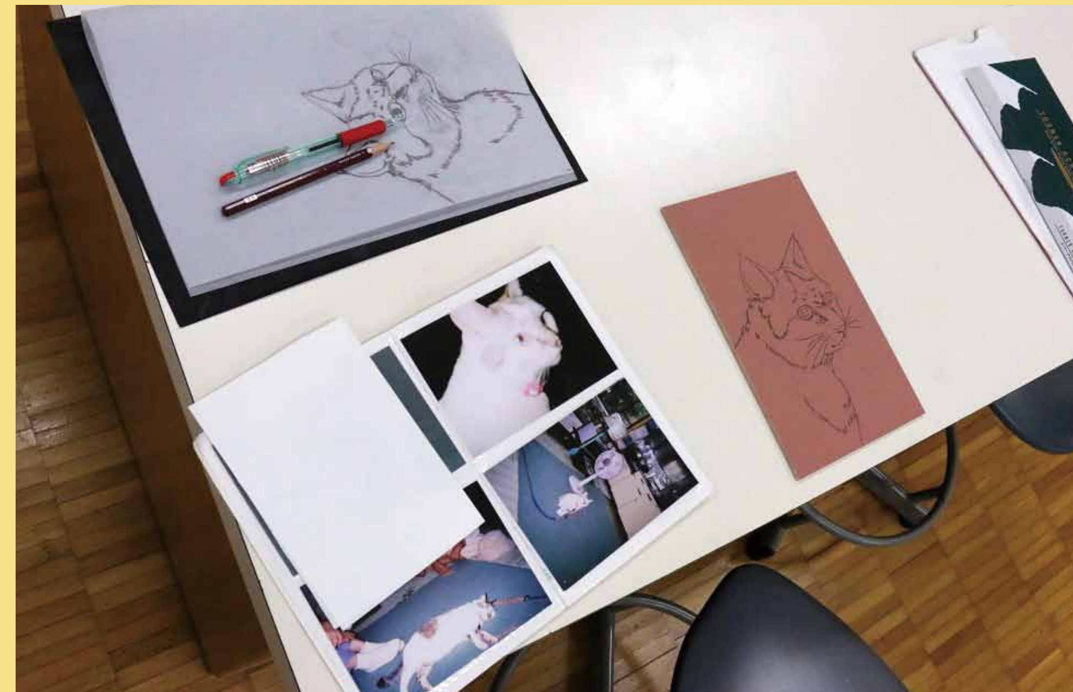
2. 写真などを参考にトレーシングペーパーに構図を決め、板に転写します。