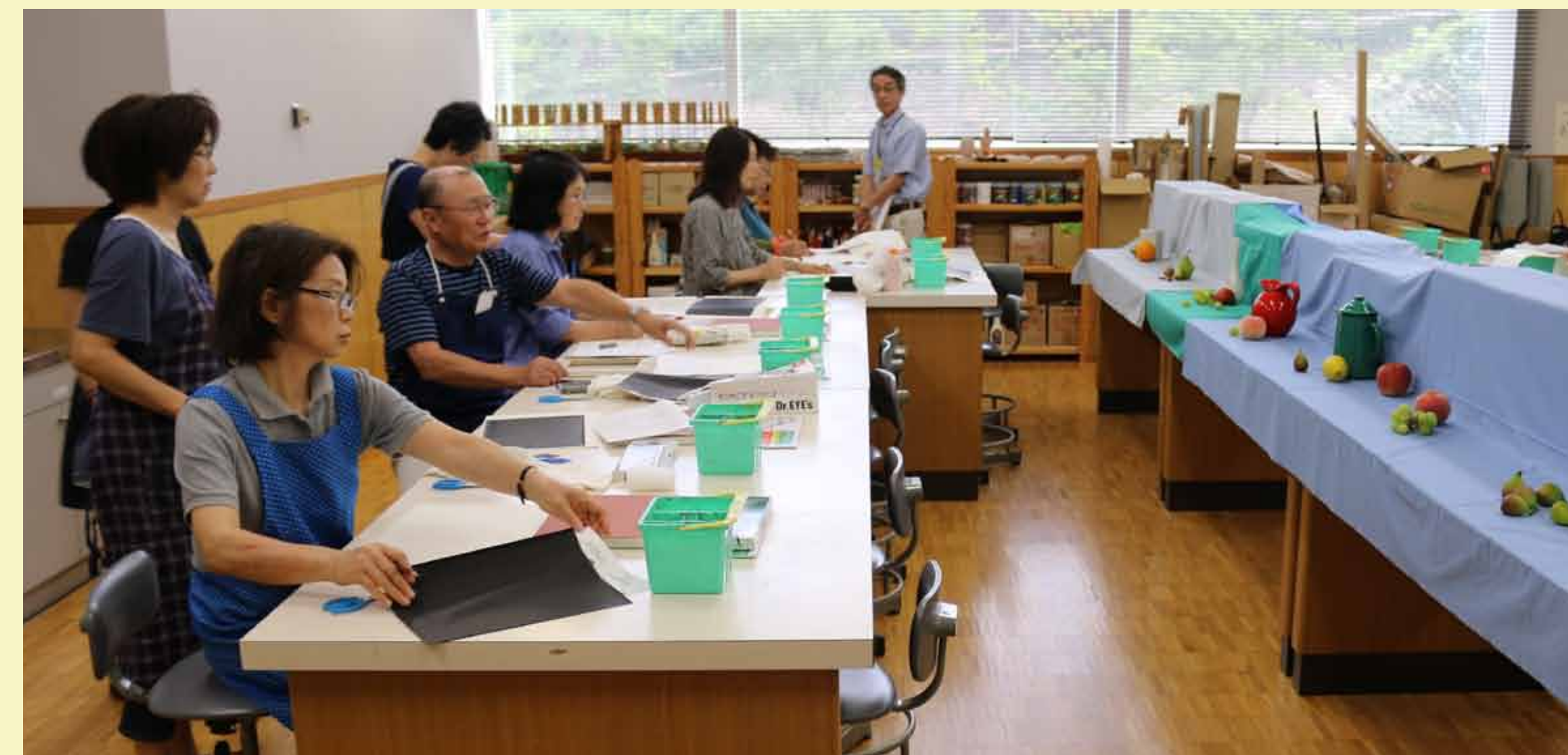
2. スケッチで大まかな形をとらえます。