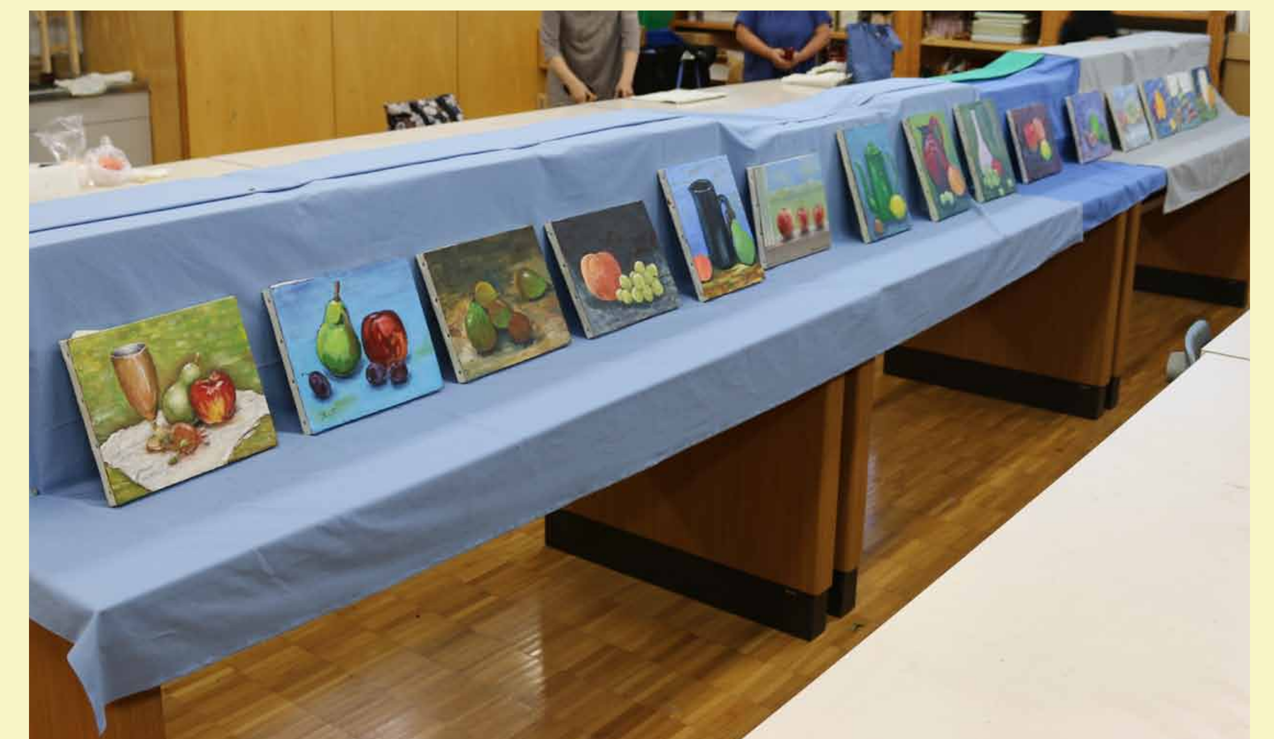
6. 楽しみながら油絵作品を完成させました！