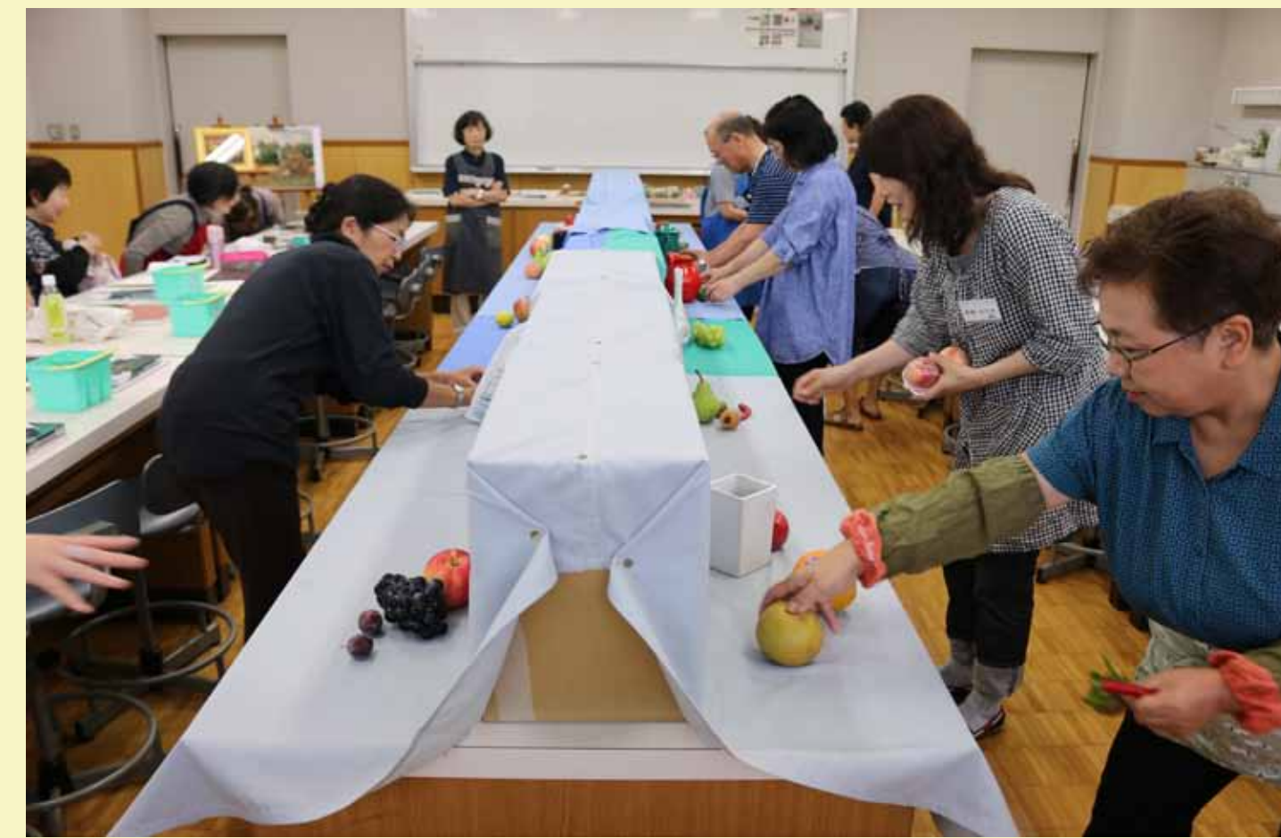
1. モチーフを決定します。どう並べようかな？