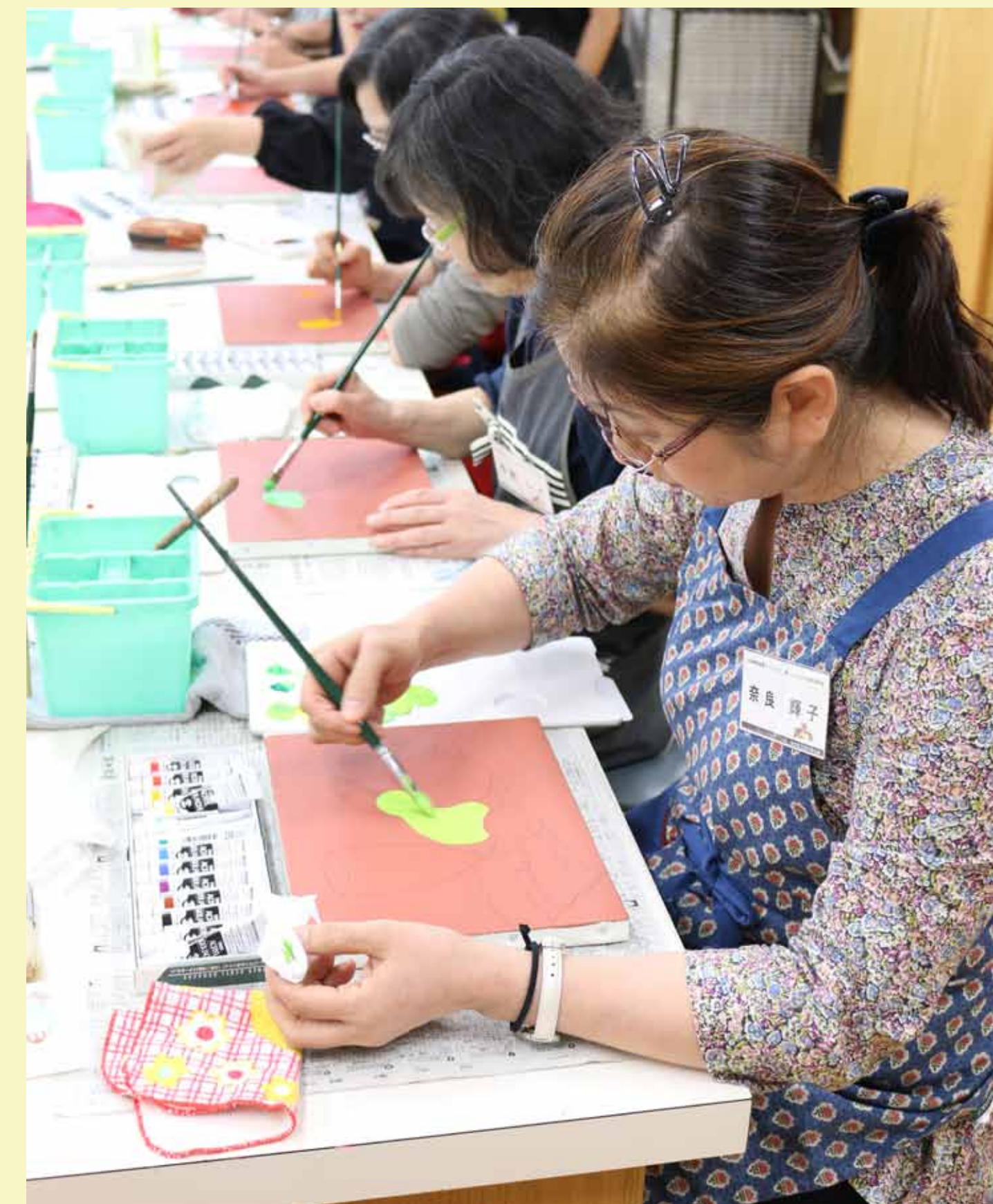
3. 大まかな色を塗ります。