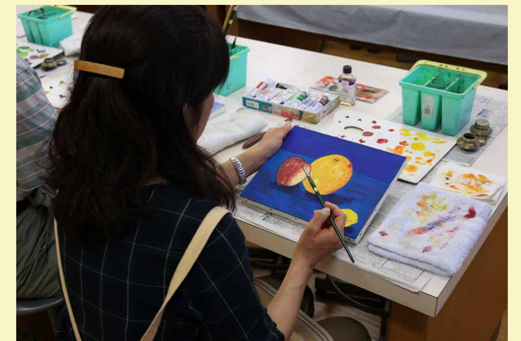
5. さらに明るさ、暗さをよく見て描きこみます。