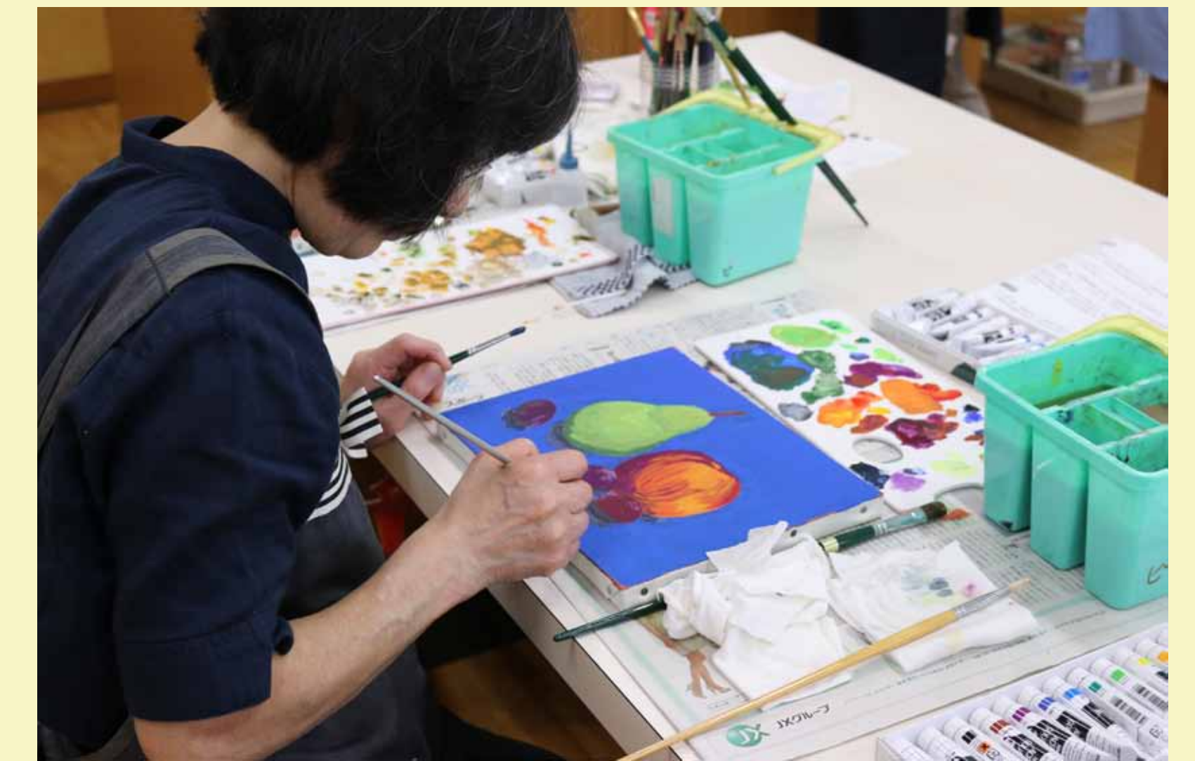
4. 大まかな陰影をつけます。