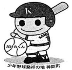
少年野球発祥の地 神岡町 イメージキャラクター「だけ丸君」